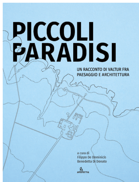
Piccoli paradisi. Un racconto di Valtur fra paesaggio e architettura (2023), a cura di Filippo De Dominicis e Benedetta Di Donato, Conegliano, Anteferma.