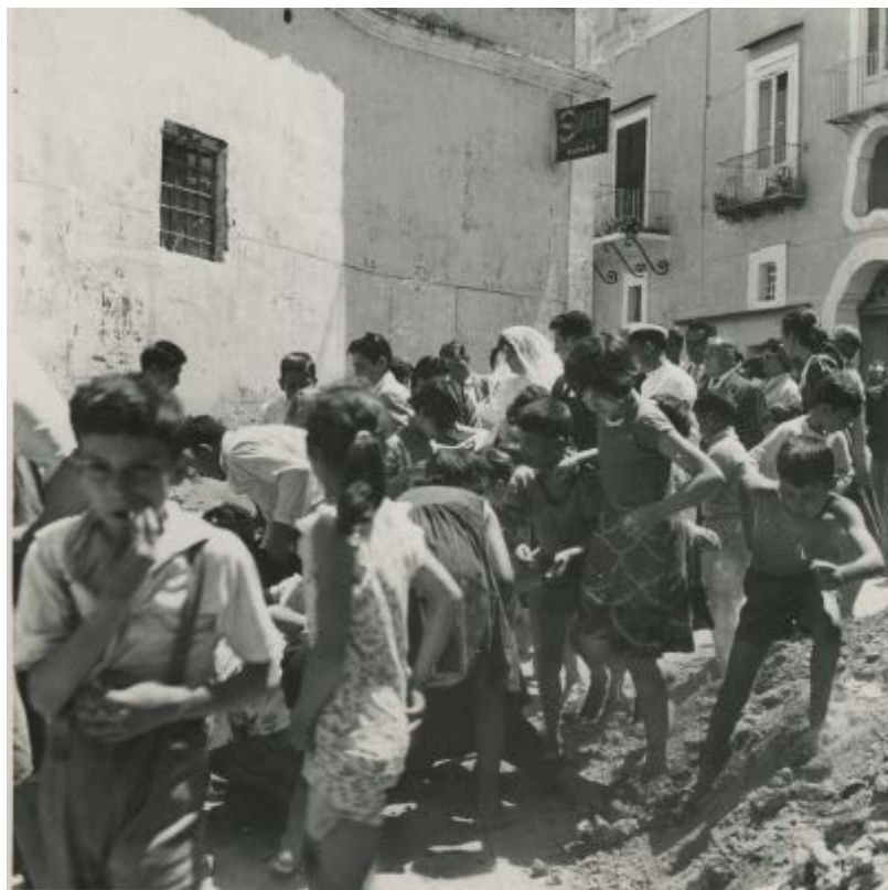
Fig. 5. Paolo di Monda, Sepino , 1960 ca. Archivio fotografico Paolo di Monda.