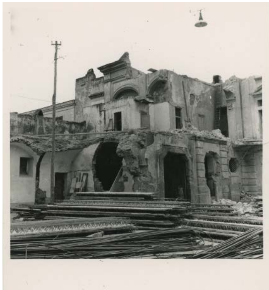
Fig. 11: Paolo di Monda, Villa Brancaccio-Pantaleo , 1958 ca.

266]. Ancor più eloquenti sono gli scatti dedicati all'abbattimento della villa Brancaccio-Pantaleo, paradossalmente non pubblicati ad eccezione di un particolare della balaustra nonostante rappresentassero l'ultima testimonianza di un'architettura «risparmiata dalla lava, ma non dalla speculazione edilizia. I resti di due pilasti sulla via Diego Colamarino, già Capo Torre, sono all'inizio di un viale rettilineo, un tempo fiancheggiato dal verde del giardino, ora un'anonima schiera di grossi edifici [...]. Recentemente, un portale a volute che concludeva il disegno delle due ali è stato con esse demolito per far posto ad una nuova casa e distruggendo [...] una delle migliori fabbriche settecentesche di tutta la costa» [di Monda 1959, 280 e 283].