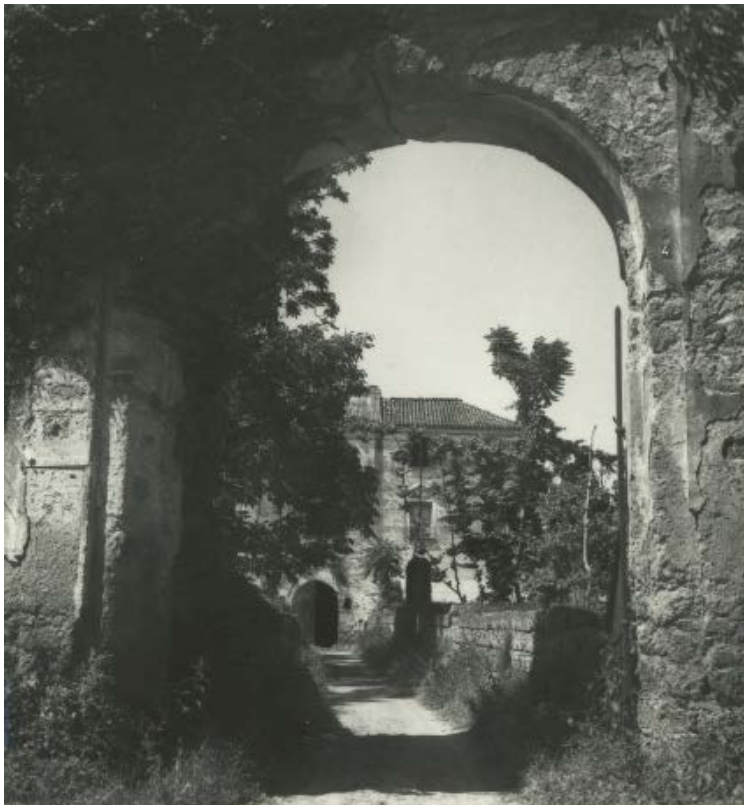
Fig. 7: Paolo di Monda, Castellammare di Stabia , 1973 ca.