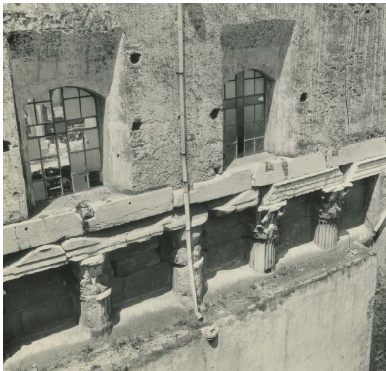
Fig. 14: Paolo di Monda, Rione Terra a Pozzuoli , 1975.