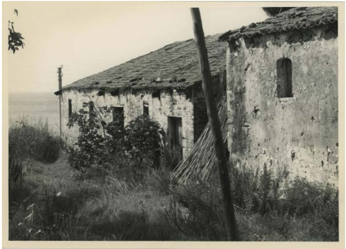
Fig. 15: Paolo di Monda, Agropoli , 1975.