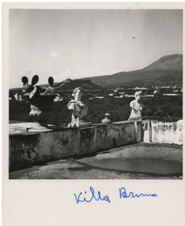
Fig. 12: Paolo di Monda, Villa Bruno , 1958 ca.

non a caso, un'ulteriore chiave di lettura degli scatti di Paolo di Monda: mi riferisco, ad esempio, alle scale di villa Palomba «dalle quali, sullo sfondo del giardino, si godono felici scorci della penisola sorrentina e Capri» [di Monda 1959, 290], di villa Granito di Belmonte, «elemento peculiare e paesistico di tutta la fabbrica perché attraverso le arcate, fra le quali si svolge la prospettiva dei rampanti, è ancora visibile il mare» [di Monda 1959, 244]. Della villa San Gennariello, «sommersa nel verde rustico», viene invece sottolineato «l'arco ornato che guarda il mare» [di Monda 1959, 298], della villa del Salvatore il «piccolo e bianco vestibolo a volta che inquadra tra due palme l'orizzonte azzurro» [di Monda 1959, 304], e della vicina villa Prota «l'arco pendulo che, legando le due ali del secondo piano, crea un belvedere verso il Vesuvio» [di Monda 1959, 298]. Estremamente suggestive sono infine le immagini della terrazza di villa Bruno-Prota, «dalla quale si scoprono le verdi pendici del Vesuvio e tutto l'orizzonte del golfo» [di Monda 1959, 298] e di villa Ruggiero, «che guarda il Vesuvio e dove si aprono i balconi incorniciati da cartigli e volute di stucco» [di Monda 1959, 270]; a quest'ultima fabbrica sono relativi i rari scatti di alcuni ambienti interni nella loro veste ottocentesca.