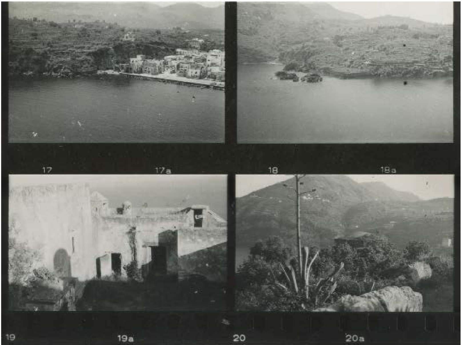
Fig. 2: Paolo di Monda, Castello di Ischia , 1954.