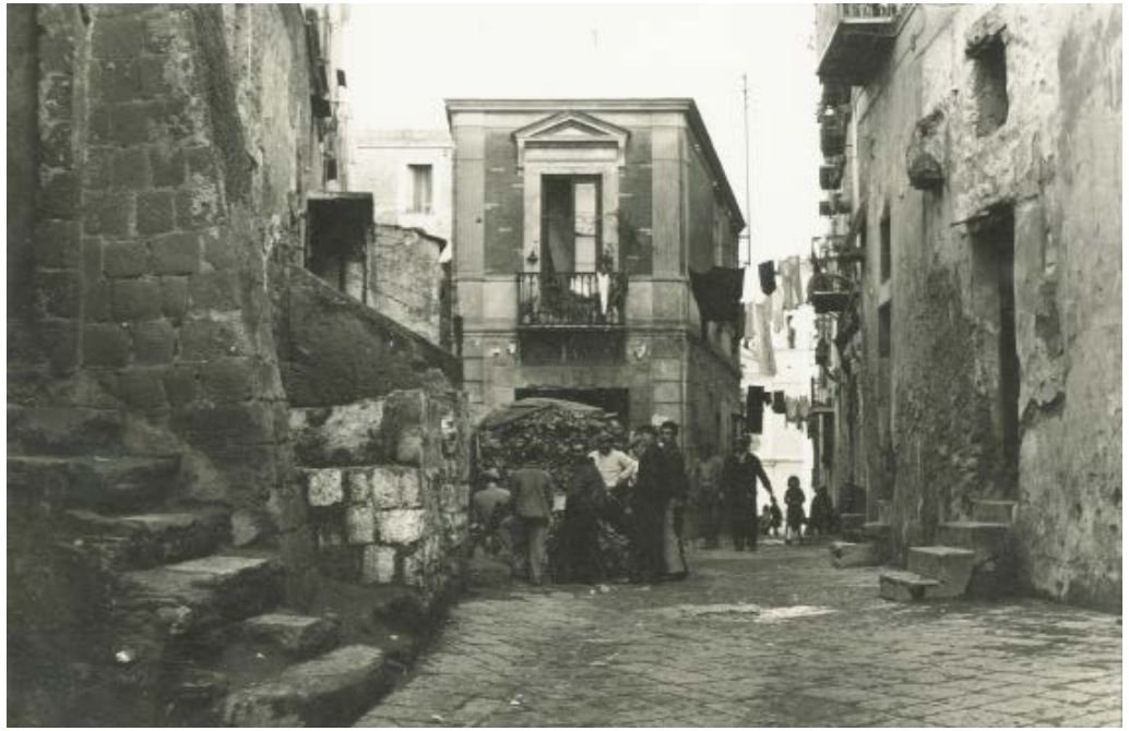
Fig. 8: Paolo di Monda, Il casale di S. Strato a Posillipo , 1962 ca.