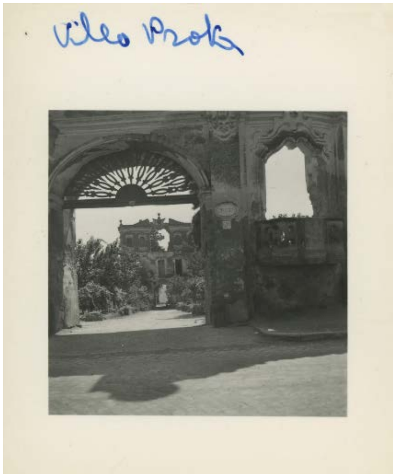
Fig. 10: Paolo di Monda, Villa Protta , 1958 ca.