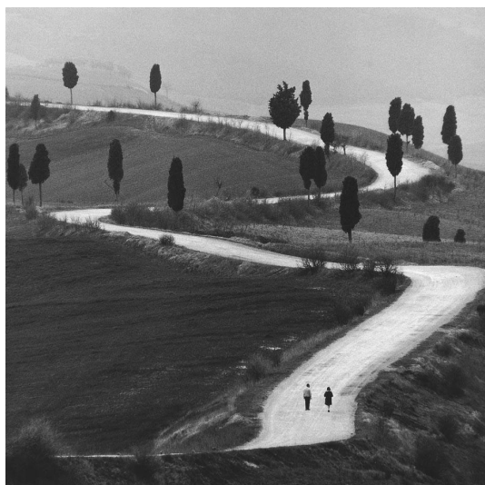
Fig. 8: Gianni Berengo Gardin, Toscana , 1965 [https://www.artnet.com/artists/gianni-berengo-gardin/toscana-iltBu8pEKTcUCNbw1iomnA2, giugno 2023].