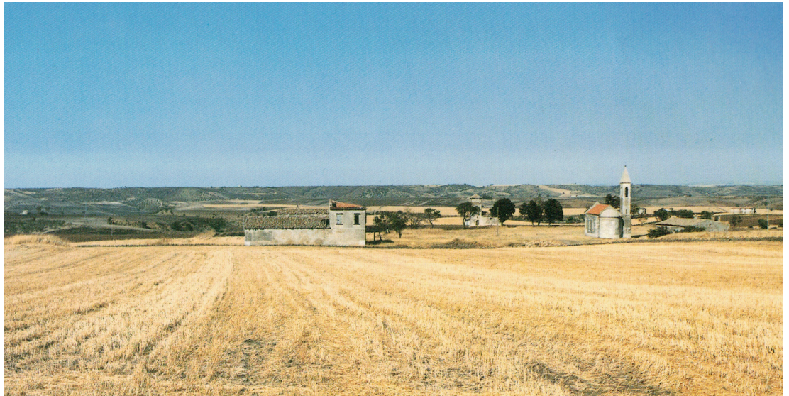
Fig. 9: Luigi Ghirri, Campagna presso Melfi , 1984 [da Lotus 52, 1986, p. 139].