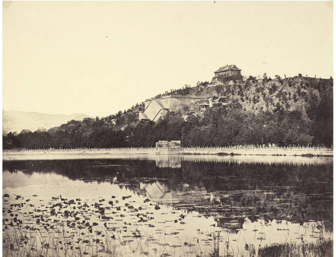
Fig. 5: Felice Beato, Il palazzo imperiale estivo dopo il rogo , Pechino 1860 [https://www.meisterdrucke.it/stampe-d-arte/Felice-Beato/829474/Vista-del-palazzo-imperiale-estivo,-Yuen-Ming-Yuen,-dopo-il-rogo,-presa-dal-lago,-Pechino,-18-ottobre-1860.html, giugno 2023].