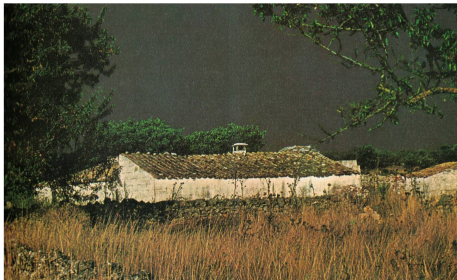
Fig. 7: Gianni Berengo Gardin, Casa colonica nel paesaggio delle Murge , s.d. [da I paesaggi umani , Milano, Touring Club Italiano, 1977].