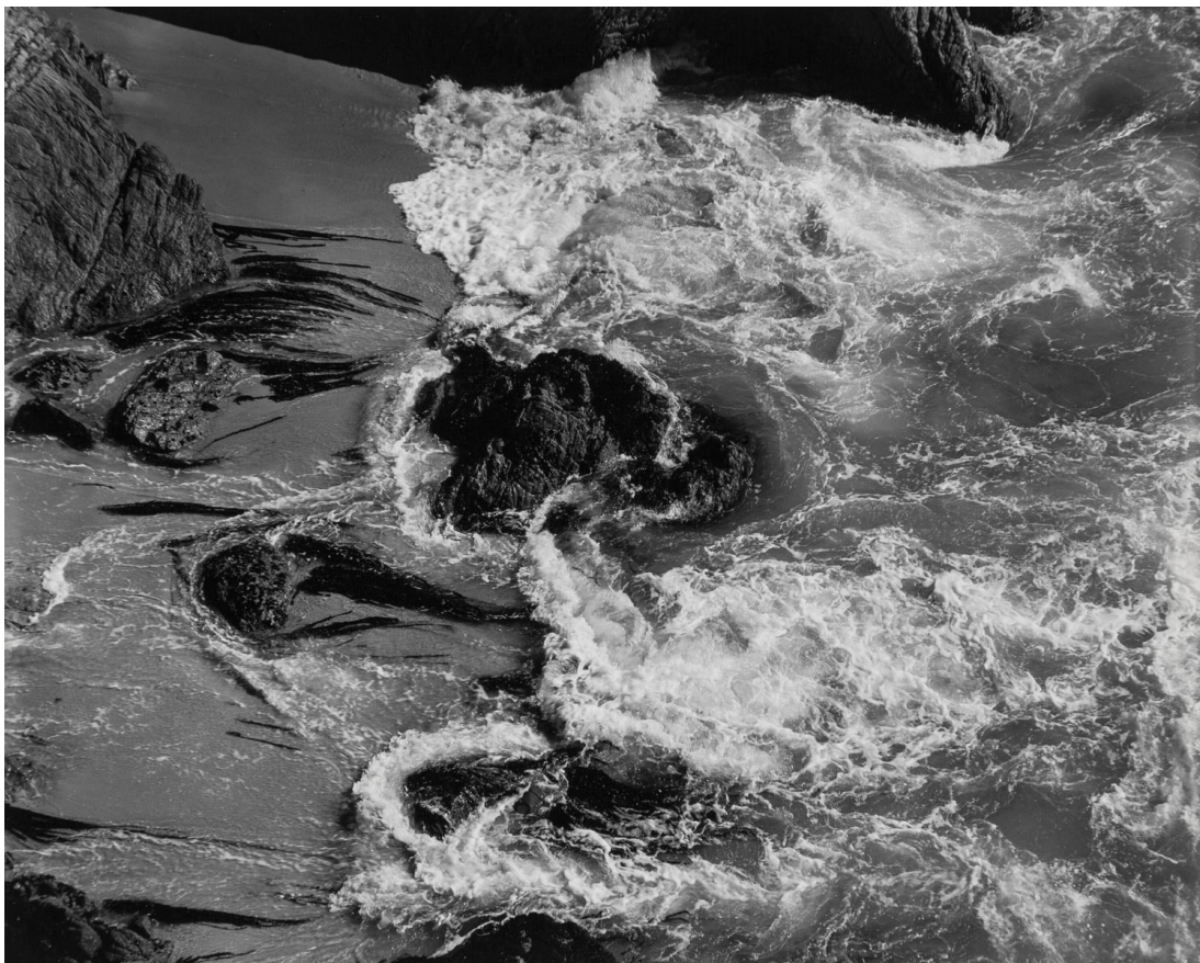
Fig. 4: Edward Weston, Surf, China Cove, Point Lobos 1938 [Center for Creative Photography, Arizona Board of Regents / Artists Rights Society (ARS), New York].