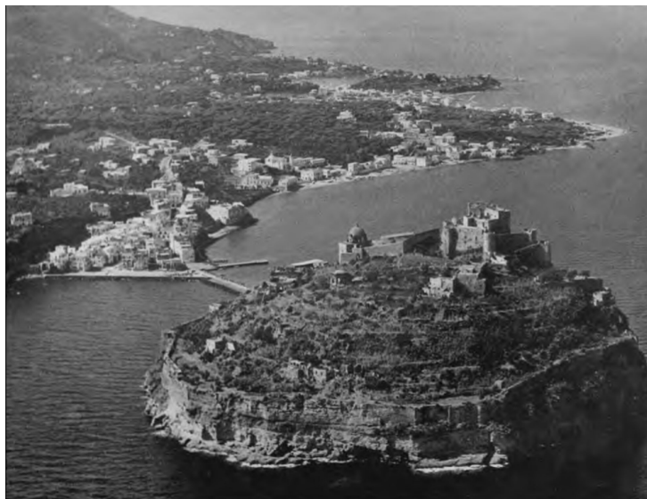
Fig. 6: Ischia, 1962 [Foto Accademia Aeronautica, da Aldo Sestini, Caratteri del paesaggio italiano «Le vie d'Italia» , novembre, 1962, p. 1323].