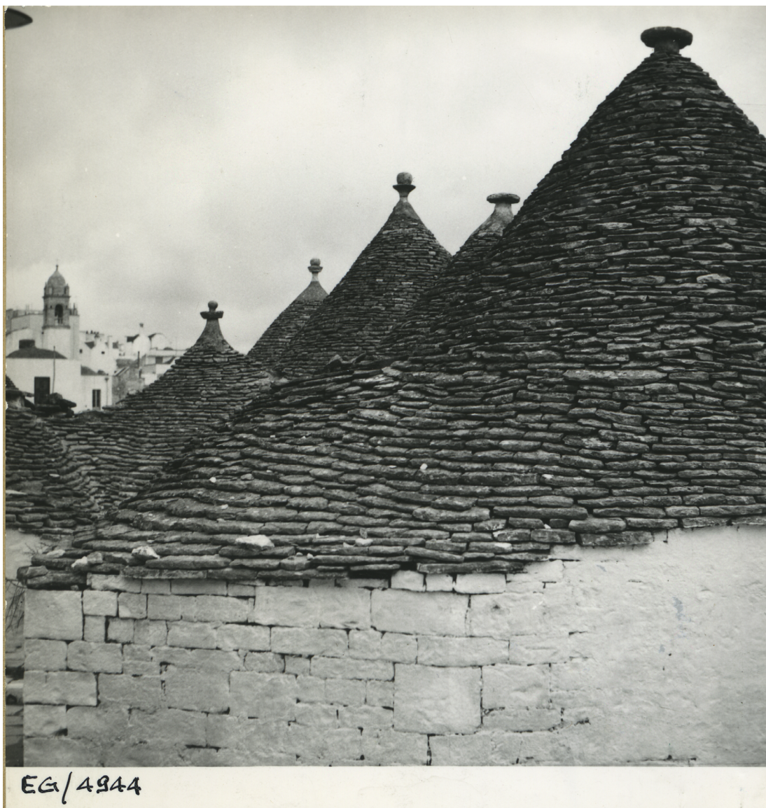
Fig. 6: E. Gellner, Vedute nel Rione Monti ad Alberobello, 1959.

tra le specchie, io dall'alto (avevo piantato la Hasselblad su treppiede e con tele in mezzo al corridoio) ogni tanto intimavo "alto, un metro avanti, mezzo metro indietro; fermi il motore!", aprivo il finestrino e scattavo; cambiavo lo chassis e facevo un altro scatto, con il colore. Dopo un lavoro di circa un'ora siamo quindi ritornati a Martina Franca. I miei compagni erano in attesa dell'ultimo piatto. Ho recuperato in fretta i primi e ho finito di mangiare con loro. Alla domanda dove ero stato ho svelato il mio stratagemma. Immaginarsi le reazioni! Le diapositive dei trulli sono tra le più belle immagini del mio archivio. Un cielo leggermente grigio-violaceo; i trulli bianchissimi di calce oppure grigi in pietra faccia a vista e legati con le specchie in pietra secco, pure grigie.