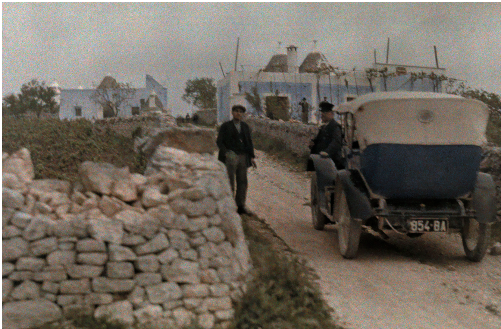
Fig. 3: L. Pellerano, Veduta in autochrome di un complesso di trulli tra Alberobello e Locorotondo (Da «The National Geographic Magazine», February 1930).

la Pratica Elementare della Fotografia a Colori (1914). Le lastre a colori di Pellerano (fig. 3) sono una straordinaria testimonianza per una lettura del paesaggio dei trulli negli anni venti. Ancora oggi, debitamente conservate presso l'archivio fotografico della National Geographic Society di Washington, serbano un'eccezionale qualità documentaria di un paesaggio rurale antropizzato oramai scomparso.