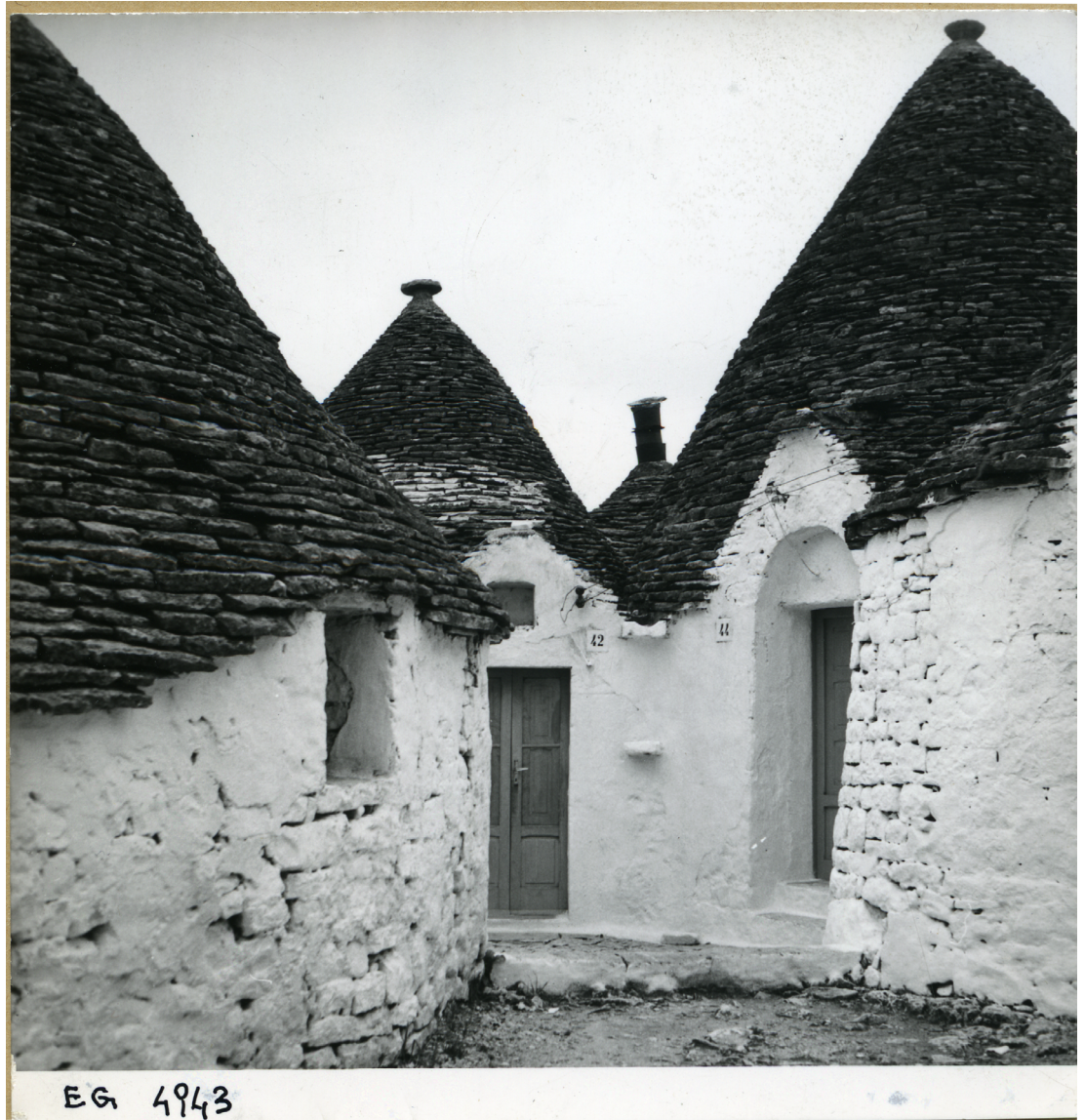
Fig. 7: E. Gellner, Vedute nel Rione Monti ad Alberobello, 1959 (fondo Gellner, Archivio Progetti, Università Iuav di Venezia).

A anni di distanza ci sono tornato: che delusione! Per allargare le strade hanno demolito i muretti; i trulli in funzione dell'agriturismo sono stati abbelliti di lanterne e cianfrusaglie e hanno la scatoletta di latta accanto la porticina d'ingresso. A Martina Franca le stradine non hanno più la bella pavimentazione a lastroni di calcare al centro e fasce di terra battuta ai lati, ma una uniforme insipida distesa di cubetti di porfido di provenienza trentina. Anche qui l'incanto è andato rotto [Gellner 2008, 90].