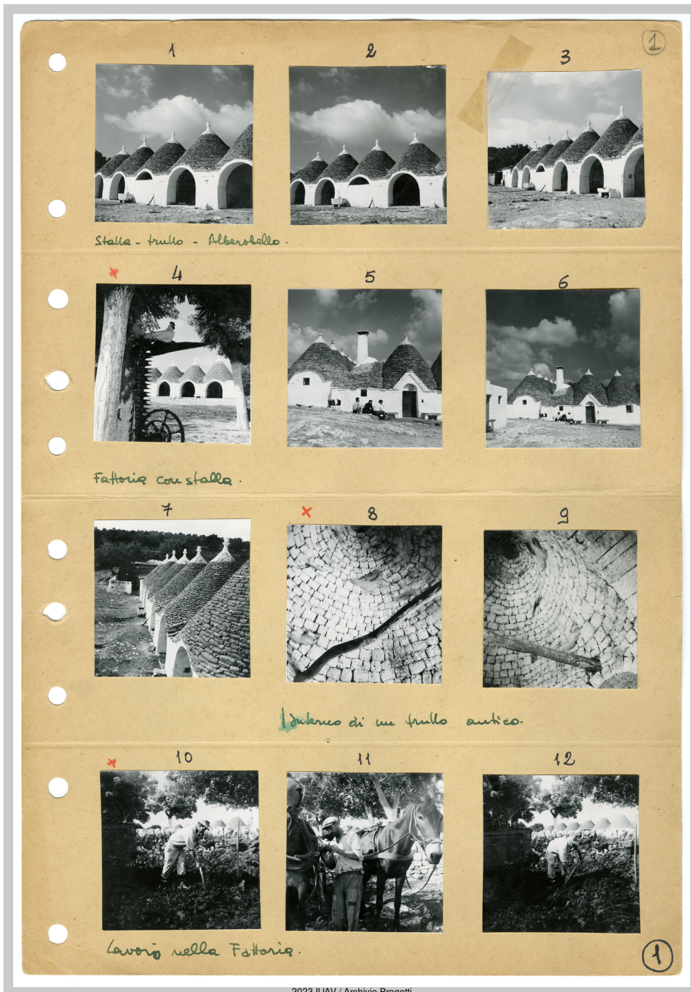
Fig. 4-5. E. Peressutti, Provinature fotografiche dalla serie Martina Franca, Alberobello e Locorotondo, 1951 c. (fondo Peressutti, Archivio Progetti, Università Iuav di Venezia).