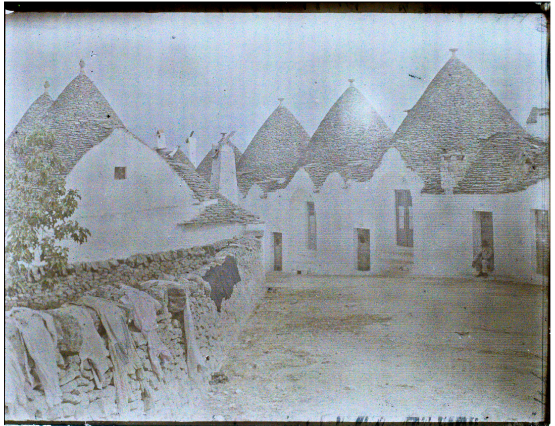
Fig. 2: A. Léon, Veduta in autochrome di un agglomerato di trulli nei pressi di Alberobello dalla campagna fotografica del 1913 per il geografo J. Brunhes.

coltivabili realizzati con muretti a secco, le sue delicate immagini di macchie bianche di trulli nel verde del paesaggio, le sue cornici architettoniche che inquadrano i contadini a riposo, restano a documentare l'equilibrio che di lì a poco si sarebbe infranto.