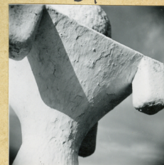
Fra Martina e Leonotondo - Cima di un fusto.