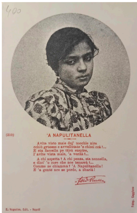
Fig. 7. 'A Napulitanella, cartolina, Ragozino editore. Testo di Ferdinando Russo.