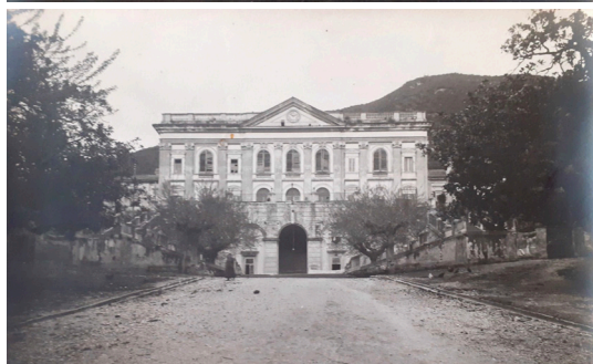
Fig. 1a, 1b: Salvatore di Giacomo, Il casinetto di Belvedere di S. Leucio , ca. 1910, Biblioteca Nazionale, Napoli.