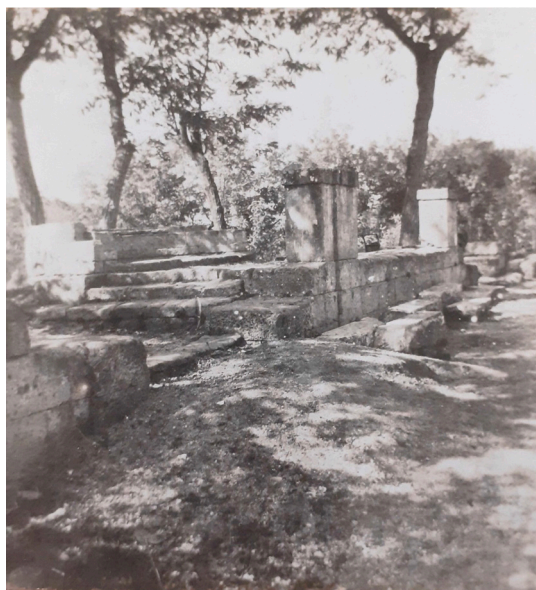
Fig. 2: Salvatore di Giacomo, Il tosello , ca. 1910, Biblioteca Nazionale, Napoli.