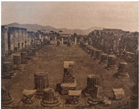
Fig. 4: Pompei. Da Napoli d'oggi 1900.