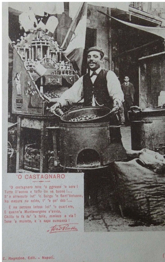
Fig. 6: 'O castagnaro, cartolina, Ragozino editore. Testo di Ferdinando Russo.

questione napoletana. Sul piano della letteratura e della saggistica è dominante il taglio realistico; centrale il ruolo del positivista Pasquale Villari, che oltre alla pubblicazione delle Lettere meridionali [Villari 1878] sollecita appunto l'altro grande classico in cui è il focus è Napoli, Napoli a occhio nudo di Fucini [Fucini 1878]. A occhio nudo: significa senza velo di retorica. La sua descrizione dei fondaci è una delle premesse per il lavoro del risanamento, che è al tempo stesso dono e punizione da parte del nuovo Stato nei confronti dell'ex-capitale più ingombrante e meno addomesticabile fra quelle degli antichi stati. Il risanamento è un'opera di razionalizzazione, normalizzazione e addomesticamento tanto urbanistica quanto culturale. Il pittoresco che era già una delle facce dell'immagine di una Napoli bifronte, riassunta dalla formula del 'paradiso abitato dai diavoli', assume i toni dell'elegia sul mondo antico ormai perduto: e anche in operazioni come «Napoli nobilissima» affiora l'ambiguità [Croce 1894]. In questa complicata definizione e ridefinizione dell'immagine della città piomba il mezzo ottico a complicare i giochi della rappresentazione: le cartoline di Napoli ne sono un indizio importante, anche per il loro carattere di veicolo internazionale dell'immagine.