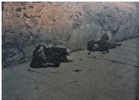
Fig. 5: Scugnizzi dormienti. Da Napoli d'oggi 1900.