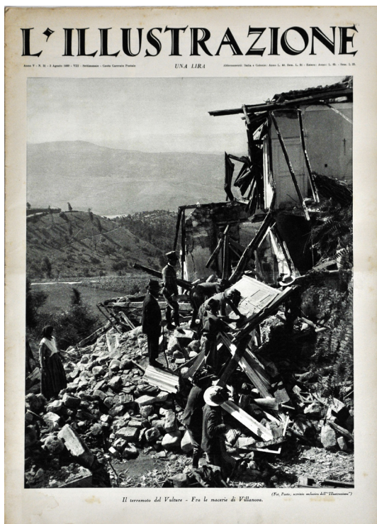
Fig. 8: Ferdinando Pasta, Il terremoto del Vulture – Fra le macerie di Villanova, «L'Illustrazione», anno V, n. 31, 3 agosto 1930.

nanti con la Puglia e la Basilicata: l'Alta Irpinia, la Baronia, l'Arianese, l'area del Cervaro. Si trattò di una vera e propria scoperta per la stampa e l'opinione pubblica nazionale, che negli anni Trenta si dimostrerà incuriosita e finanche attratta, al netto delle rappresentazioni strumentali e propagandistiche imposte dal regime mussoliniano, da questa terra sconosciuta e povera, della quale fotografi e giornalisti presenteranno i risvolti più pittoreschi, costruendone un immaginario decisamente idilliaco e rassicurante nel segno delle buone tradizioni che improntavano, nella narrazione del regime, la vita sana delle famiglie e dei paesi italiani.