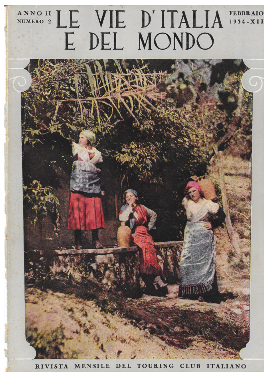
Fig. 4: Vittorio Tedesco Zammarano, Donne dell'Irpinia alla fontana, «Le vie d'Italia e del mondo», anno II, numero 2, febbraio 1934.

La chiara demarcazione di stili che si riscontra, anche a una visione superficiale, nei reportage fotografici sul terremoto del 1930 è determinata non certo da un divario di qualità artistica tra i