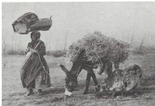
Fig. 10: n.f., Contadina di Andretta, «La lettura», anno XXX, n. 1, 1° settembre 1930.

ultrasecolare: «I costumi sono ancora – in molti paesi – quelli ricchi e sgargianti della tradizione. Così le contadine di Bisaccia indossano gonne rosse, tutte pieghettate, legate dietro da un laccio di oro. Dal corpetto di seta multicolore pendono grossi ciondoli di argento, e sulle spalle è attaccato un bel collo di merletto; in testa uno scialle, incrociato in modo da lasciar vedere il collo adorno di collane di oro. Le donne di Calitri, invece, hanno gonna nera, con il corpetto attaccato da nastri rossi. Pendono dalle bretelle dietro le spalle altri nastri dai colori vivaci; le maniche, di seta o di lana, son molto corte, ornate di gallone argentato o dorato. Una particolarità che distingue nettamente le zitelle dalle maritate è il cosiddetto ‘pizzillo’, riccio di merletto inamidato, che segna una larga scollatura. Distintivo, questo, che spetta esclusivamente alle maritate, mentre le zitelle non hanno alcun ornamento al collo della camicia, e portano una scollatura più modesta e decente. Montecalvo ha il costume, forse, più bello: una camicia di mussola, un corsetto di panno scarlatta ornato di bottoni di argento a doppia fila; gonna scarlatta anche essa, con sopra un grembiule di seta. Le scarpe hanno una larga fibbia di argento; sulla testa una tovaglia di lino o di cotone. Tutto il vestito è ricamato di oro o di argento» [Stocchetti 1930].