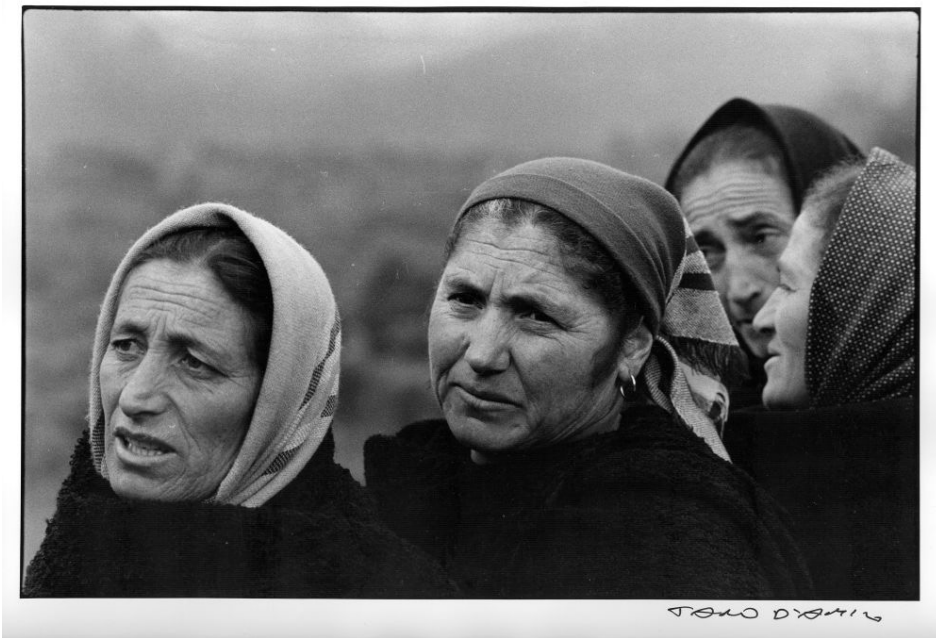
Fig. 11: Tano D'Amico, Donne dell'Irpinia (Calabritto, dopo il terremoto, novembre 1980), in Tano D'Amico, Con il cuore negli occhi , Edizioni Kappa, Roma, 1982.