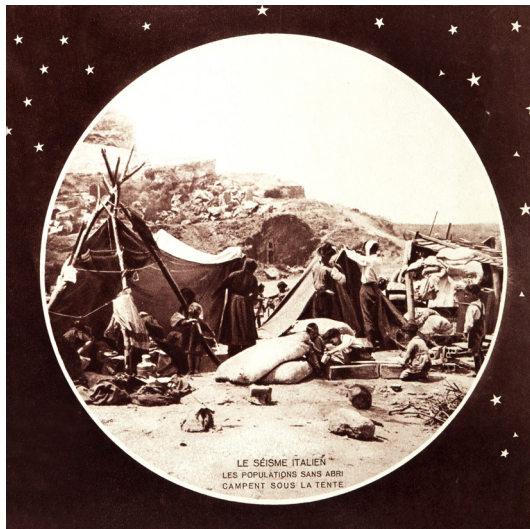
Fig. 7: Le sèisme italien. Les populations sans abri campent sous la tente , «Le Miroir du monde», anno I, n. 22, 2 agosto 1930.

fotografi italiani e stranieri, ma esclusivamente da queste ragioni di natura geopolitica.