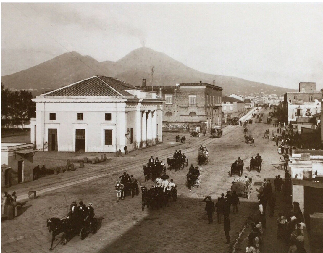
Fig. 1: Giacomo Brogi, Napoli. Ritorno dalla Festa di Montevergine , fine '800 – inizi '900, Archivio Alinari, Firenze.