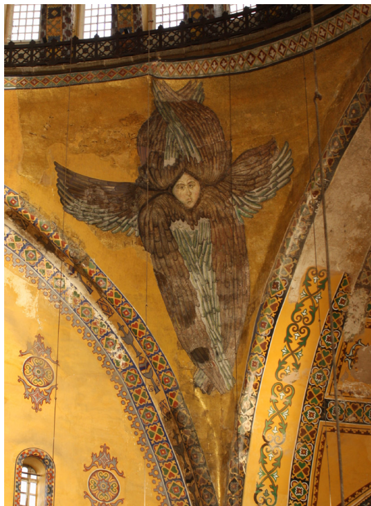
Fig. 6: Santa Sofia, Angeli serafini in volo sui pennacchi. Foto dell'autrice, 2011.

muri laterali, su paraste appena emergenti, liberando completamente lo spazio interno di questa inusuale navata.