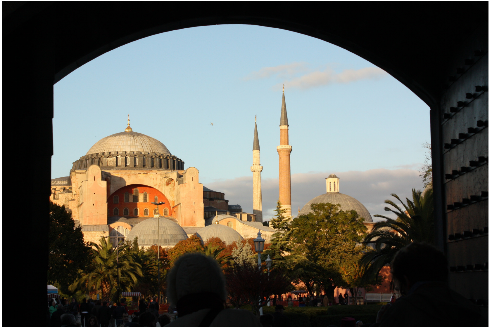
Fig. 4: Santa Sophia, vista esterna dei contrafforti in direzione nord-sud.