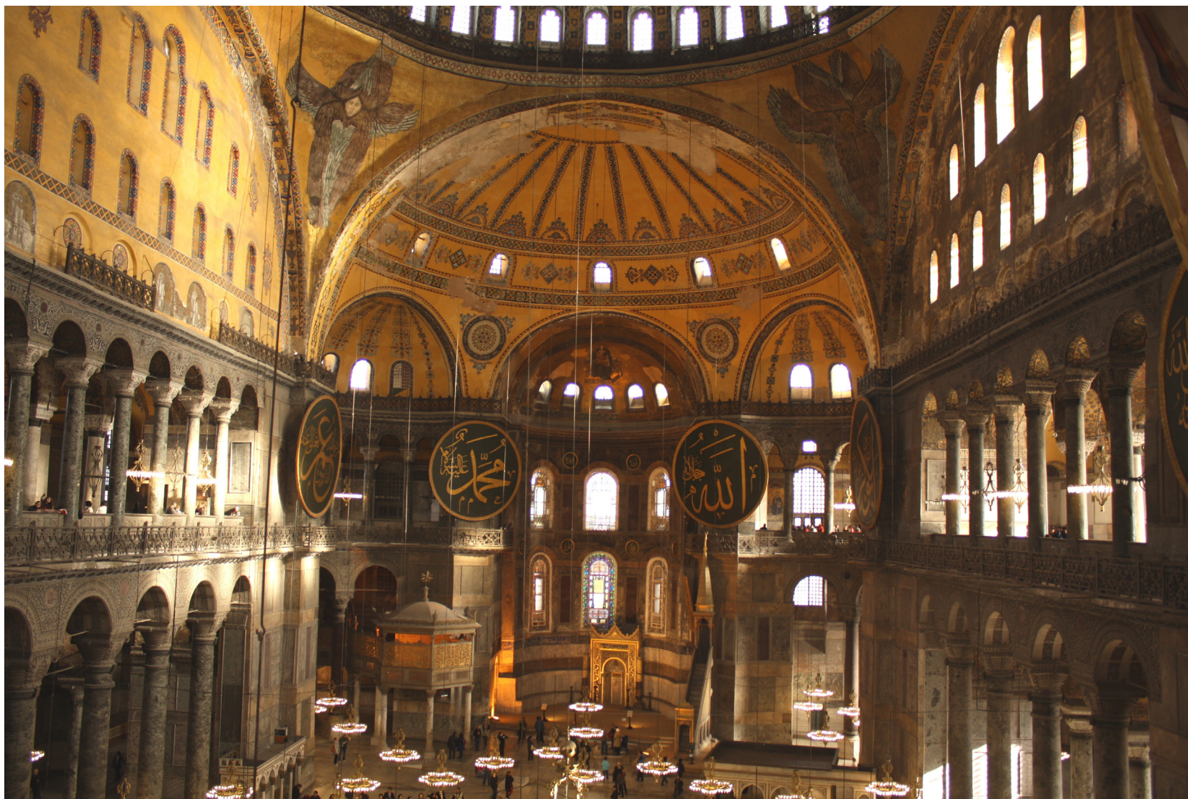
Fig. 5: Santa Sophia, vista interna dal matroneo.