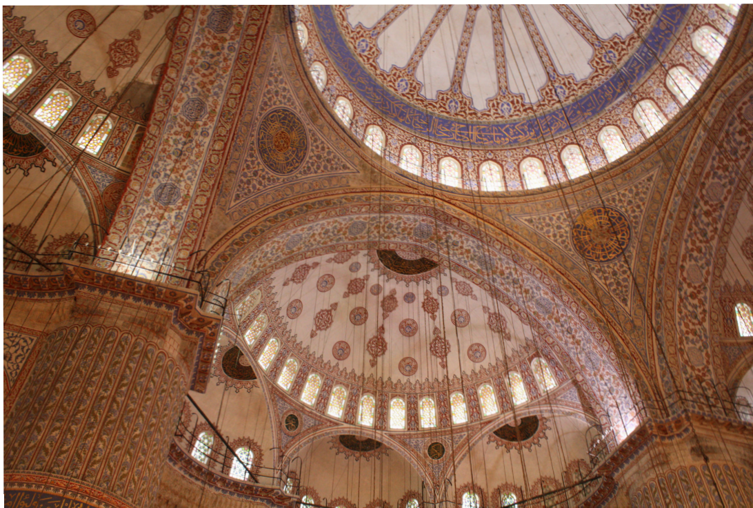
Fig. 7: Istanbul, Sedefkar Mehmet Aga, Moschea Blu, 1597-1616.