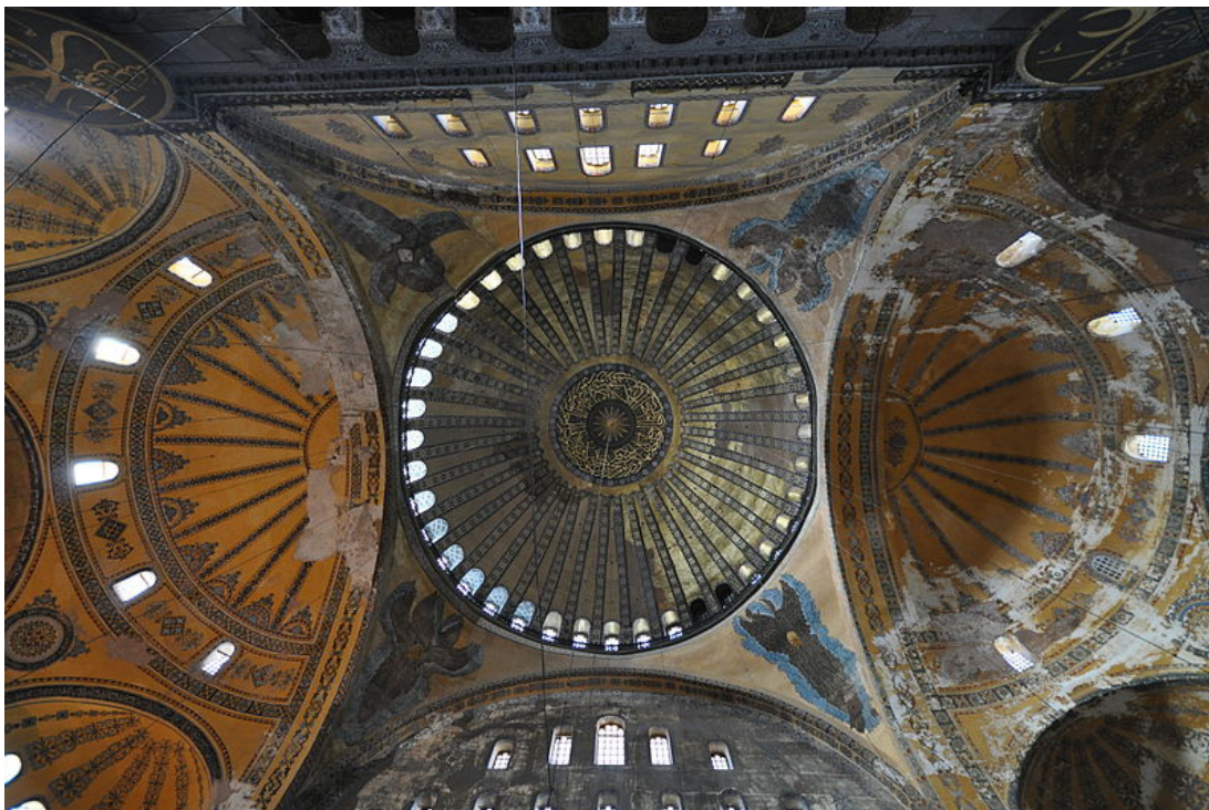
Fig. 3: Santa Sophia, la volta composita vista dal basso.

temio e Isidoro, crollata nel 558 d.C., dovesse avere un profilo ribassato molto più accentuato di quella attuale, ossia una calotta più bassa di 6 metri, potrebbe confermare l'ipotesi che l'intento non era quello di conseguire la massima altezza nel punto centrale della chiesa con l'inserimento di una cupola a tutto sesto, ma piuttosto il contrario, mantenendo bassa la cupola, di unificarne quanto più possibile il profilo ai due sottostanti catini (fig. 3).