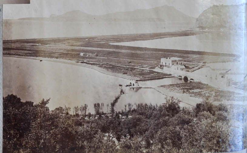
Campi Elisi = Baia = In lontananza le isole Procida e Ischia