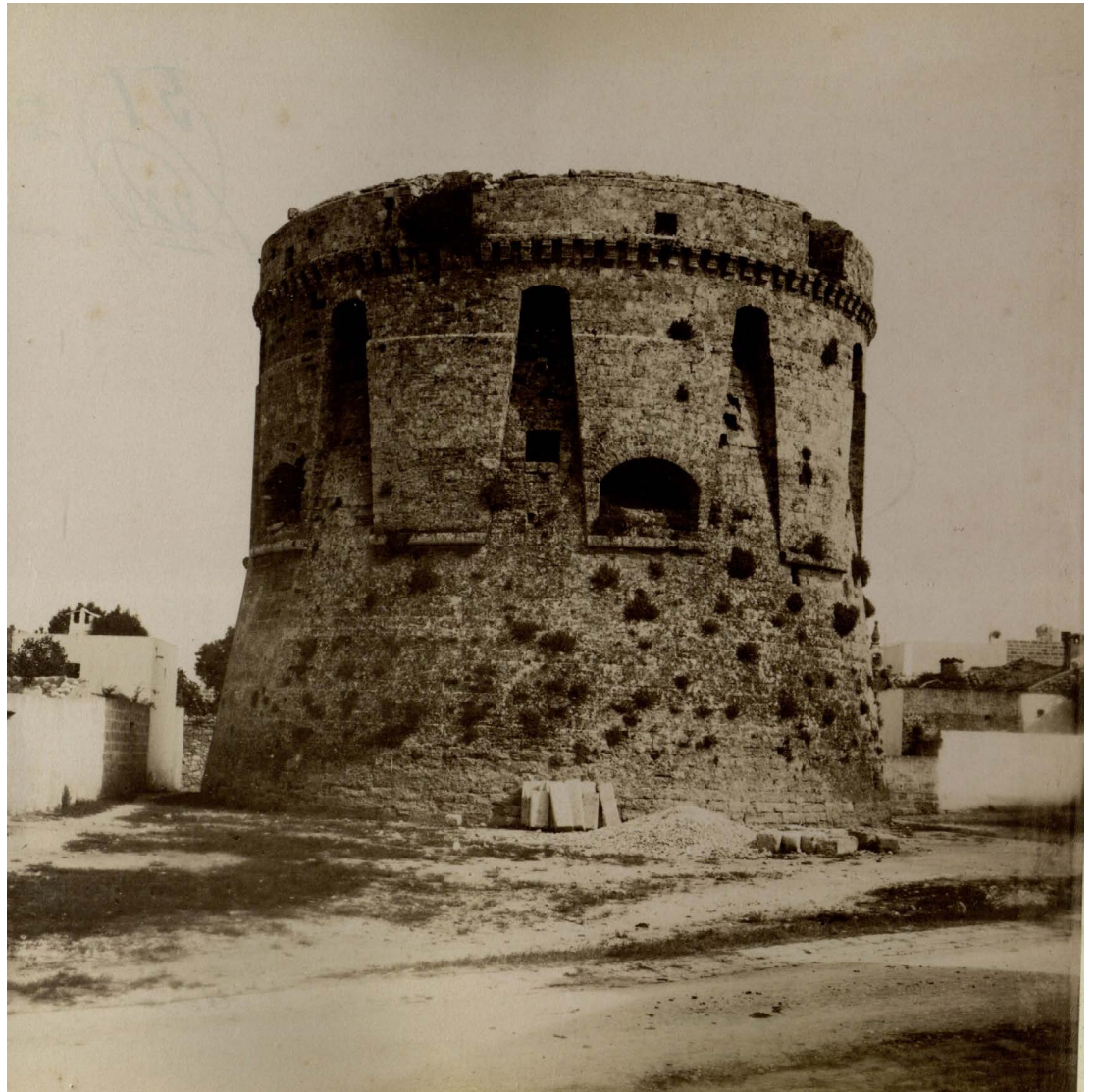
Fig. 7: Torre di Salignano (Lecce), 1870-1880.

Quale immagine conclusiva si propone la seguente, a testimonianza di quanto espresso. Detta anche Torre Saracena, costruita nel 1550 faceva parte di un sistema di torri e architetture difensive dell'entroterra, costituendo una seconda linea contro eventuali attacchi dei pirati. Non