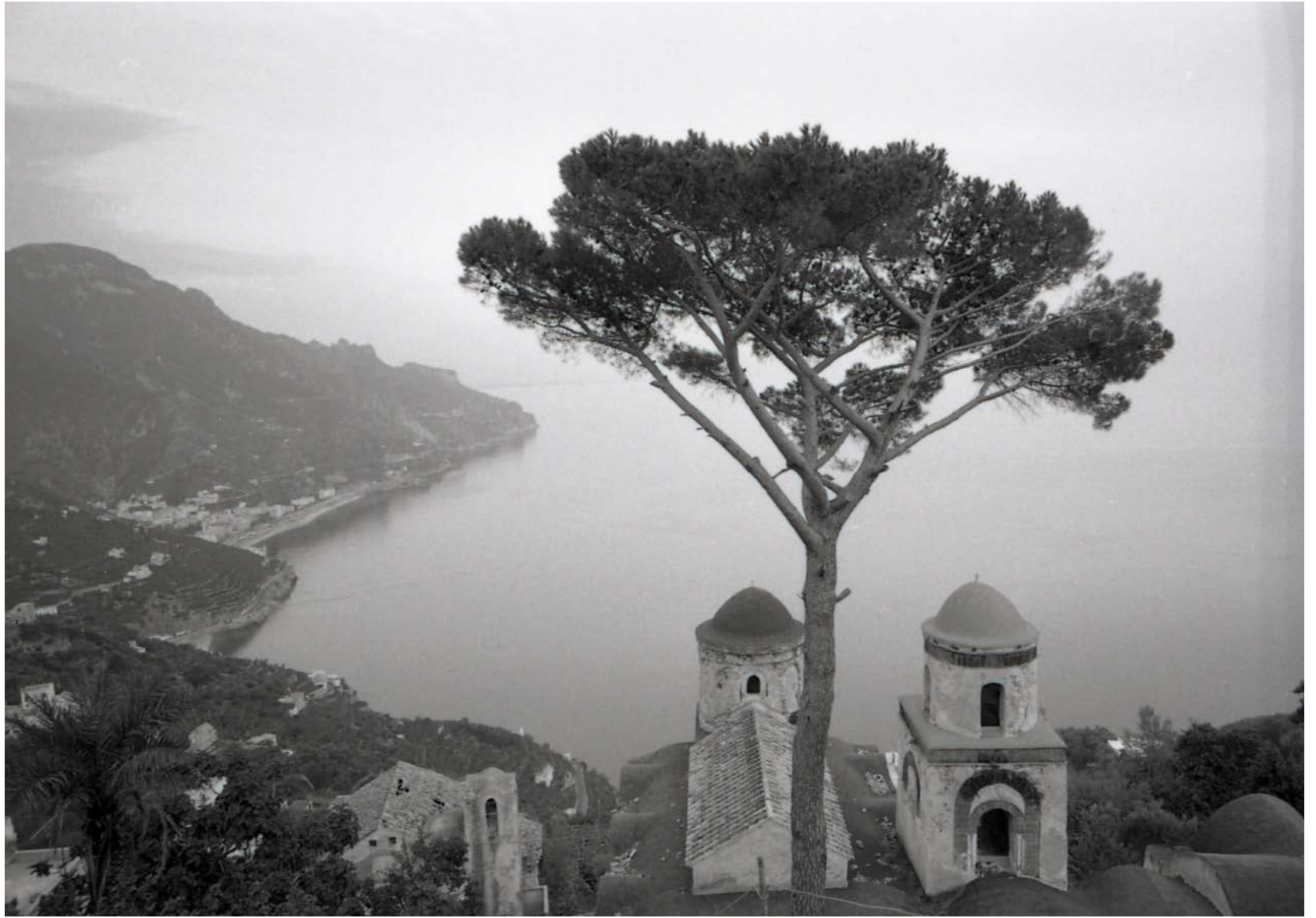
Fig. 2: Paolo Monti, Servizio fotografico Ravello, 1965. BEIC 6328867 (vista sul mare da villa Rufolo).