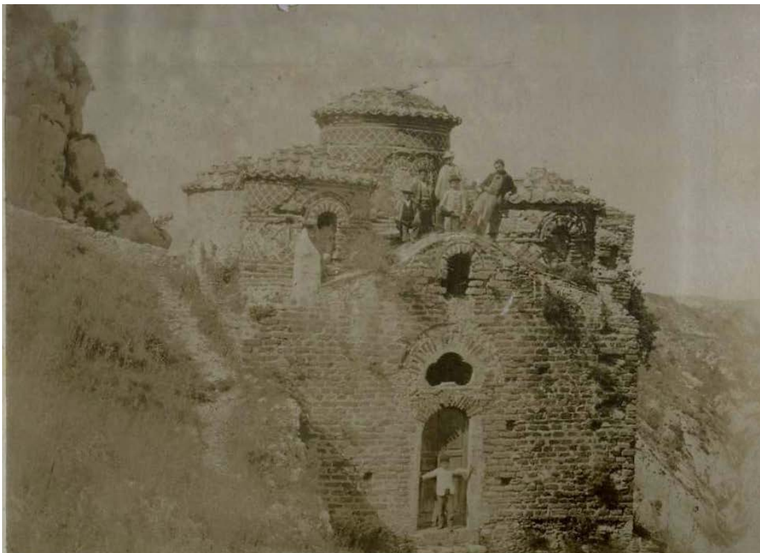
Fig. 6: Reggio Calabria, Stilo-Cattolica, 1880-1890.