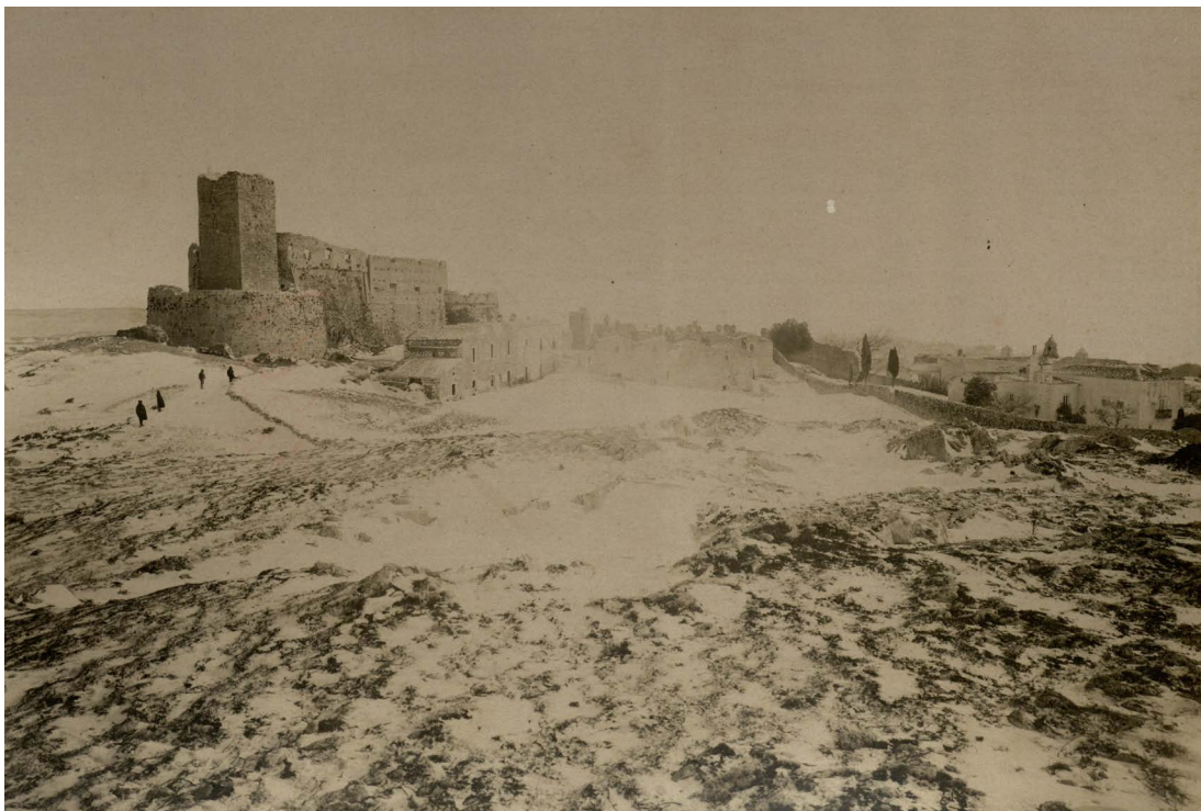
Fig. 1: Montesantangelo (Foggia), 1870-1880.

dell'Ottocento ritraggono quelle ritenute le più belle mete turistiche, utilizzate di lì a poco per le cartoline, per diffondere l'immagine del "bel paesaggio" italiano, sono ancora oggi modelli visivi consolidati nell'immaginario collettivo, un modello tuttora di riferimento per rappresentare il paese e i suoi patrimoni d'arte e paesaggistici attraverso la fotografia. Ancora oggi, le campagne fotografiche dell'ICCD-Istituto centrale per il catalogo e la documentazione, o quelle commissionate da enti locali a fotografi professionisti, spesso autori importanti, sono condotte seguendo regole simili a quelle dell'Ottocento, a partire dalla raccomandazione di una visione nitida del soggetto rappresentato, con l'adozione di una prospettiva lineare, di una angolazione più spesso appena laterale e con ripresa leggermente dall'alto, da un edificio, o un belvedere, antistante.