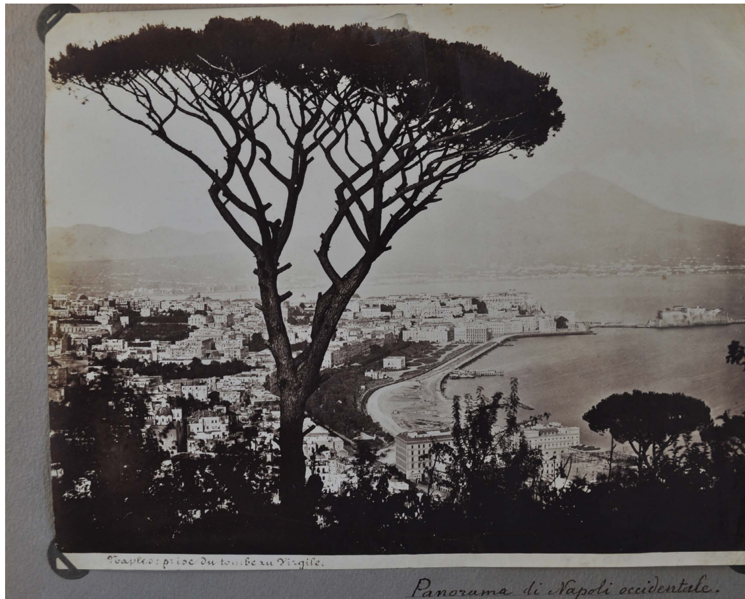
Fig. 3: Panorama di Napoli occidentale dalla Tomba di Virgilio, 1880-1890.