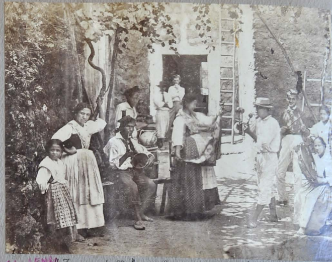
Tarantella napoletana all'isola di Capri.