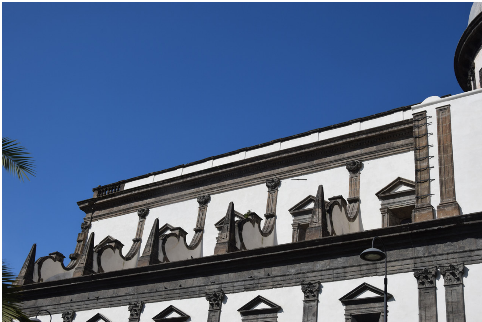
Fig. 3: Particolare del raccordo esterno tra primo e secondo livello della chiesa, 2024.

Un ulteriore elemento peculiare dell'impianto risiede nel suo rapporto con le infrastrutture idriche. Il toponimo «Formiello» si collega infatti al formale , ramo principale dell'acquedotto della Bolla, che entrava in città in prossimità della chiesa: la cisterna posta sotto il cortile trapezoidale in vicolo Santa Caterina a Formiello, costruita nel 1543 per uso conventuale, era alimentata da una sua diramazione. L'opera infrastrutturale è ancora oggi di difficile datazione, risalendo comunque all'epoca romana, se non greca, di sviluppo della città; essa rappresentava non solo la principale via di adduzione idrica al centro urbano, ma anche un passaggio strategico utilizzato da bizantini e aragonesi per violare le mura. Nel volume del 1996, pur lamentandosi l'assenza di rilievi sistematici sul tracciato interno all'area urbana, si propone un'attenta ricostruzione delle