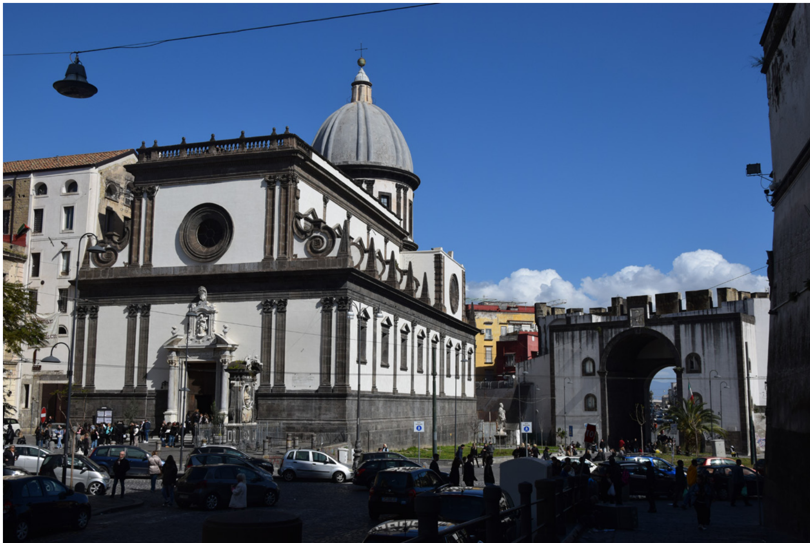
Fig. 1: La chiesa di Santa Caterina a Formiello, 2024.

zione di San Pietro a Majella); più significativa è l'indicazione del campanile, essendo la mappa sempre precisa e attendibile in merito. Non essendo rappresentati gli altri corpi del complesso conventuale, a differenza degli altri aggregati di simile natura, che vengono sempre rappresentati nella loro interezza, si deduce che l'area è stata raffigurata in un momento intermedio della storia di rinnovamento dell'impianto. Difatti, nella veduta di Lafréry-Du Pérac del 1566 si riconosce un complesso di dimensioni significativamente maggiori, con la cupola su tamburo cilindrico a copertura della crociera, ma priva del campanile osservato nella raffigurazione di Theti. Nella rappresentazione di Mario Cartaro di fine Cinquecento si riconoscono ulteriori dettagli nell'in-