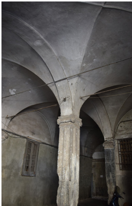
Fig. 5: Un pilastro con capitello mormandeo negli ambienti del chiostro grande, 2024.

Filangieri, Ceci e Pane [Filangieri di Candida 1931; Ceci 1900; Pane 1975] nel XX secolo. Malgrado numerosi contributi in merito, ad oggi resta ancora aperto il dibattito sull'attribuzione del progetto originario: alcuni studiosi hanno avanzato il nome di Giovanni Francesco Mormando (1449-1530), architetto attivo presso la corte aragonese e autore di opere analoghe, come la chiesa di San Michele a Vibo Valentia, di cui si rinvencono forme simili nel chiostro grande (fig. 5). Altri hanno proposto un collegamento con la cerchia di architetti toscani presenti a Napoli all'inizio del Cinquecento, tra cui Romolo Balsimelli da Settignano, che va però riconosciuto, come testimonia Filangieri, al più come direttore dei lavori, essendo stato chiamato a Napoli con ogni probabilità da Andrea da Fiesole. Alla luce dell'articolato panorama attributivo emerso dalla storiografia e dalle analisi stilistiche e storiche condotte finora, pur se criticata da più cronisti in ragione delle marcate competenze tecnico-militari, si ritiene più verosimile la paternità di Antonio Marchesi da Settignano (1451-1522), noto anche come «Fiorentino della Cava», forse per la mina da lui fatta brillare nei sotterranei di Castel Nuovo contro l'assediatore Carlo VIII [Maselli Campagna 2007], complici le affinità coi modelli fiorentini e con l'opera di Francesco di Giorgio Martini (1439-1501), diffusa nel Regno attraverso codici e disegni.