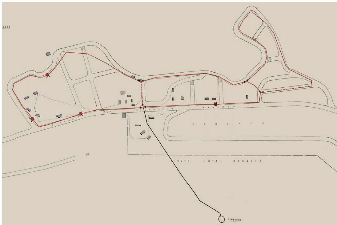
Fig. 14: Progetto esecutivo rete di distribuzione per l'acquedotto di Villa Racise.