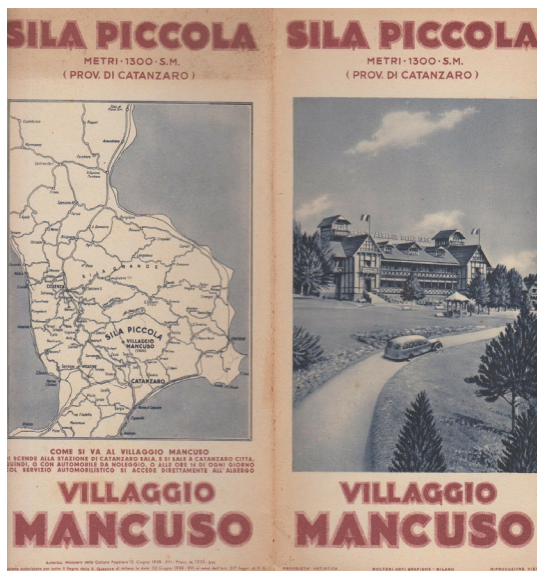
Fig. 4: Pieghevole pubblicitario del Villaggio Mancuso.