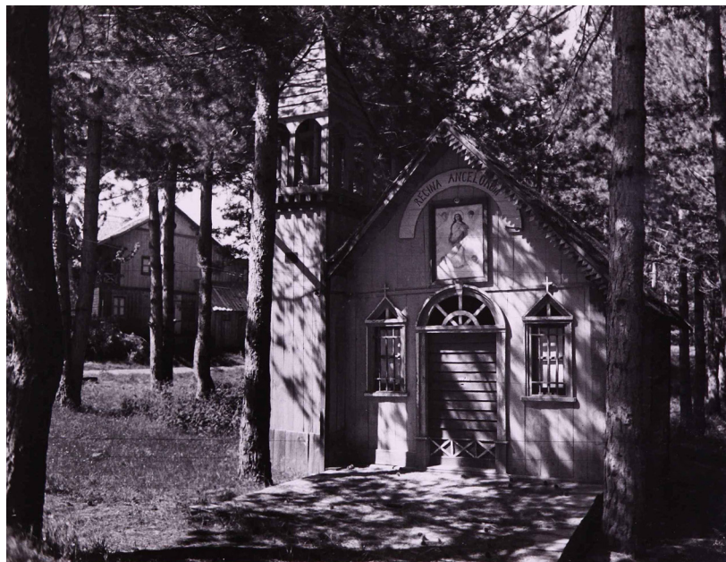
Fig. 6: Scorcio dei villini immersi nella vegetazione boschiva.