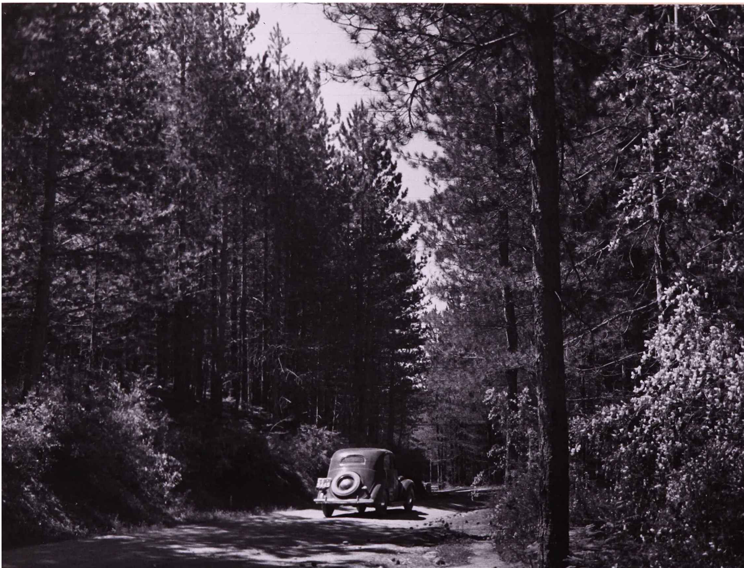
Fig. 7: Le comunicazioni carrabili realizzate nella foresta. (ACS, Miscellanea A, album 23, neg. 675).