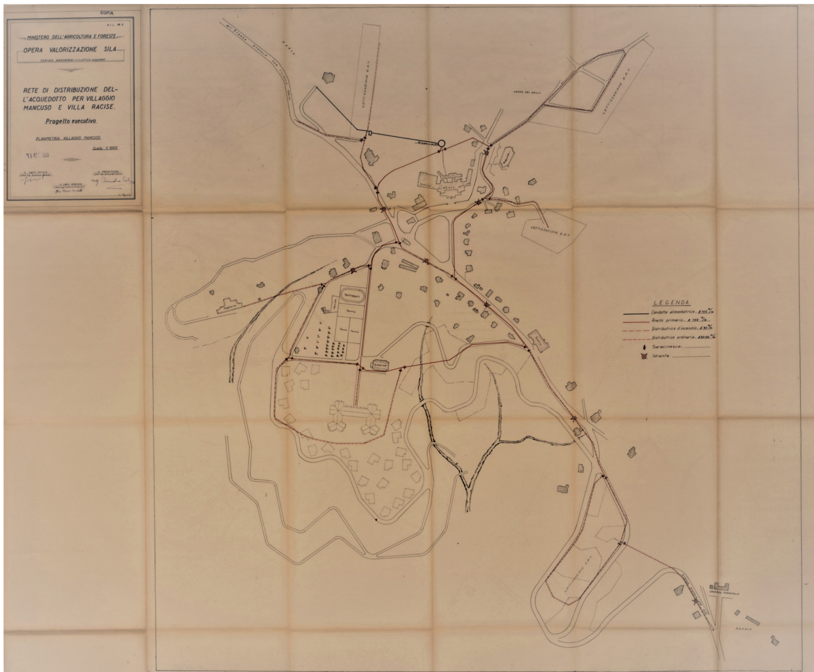
Fig. 13: Progetto esecutivo rete di distribuzione per l'acquedotto di Villaggio Mancuso (ACS, Ministero Agricoltura e Foreste, DG Bonifica e Colonizzazione, OVS (1951-1955), b.66, fasc.47).