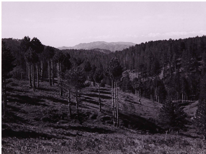
Fig. 3: Emblema della città di Ravenna.