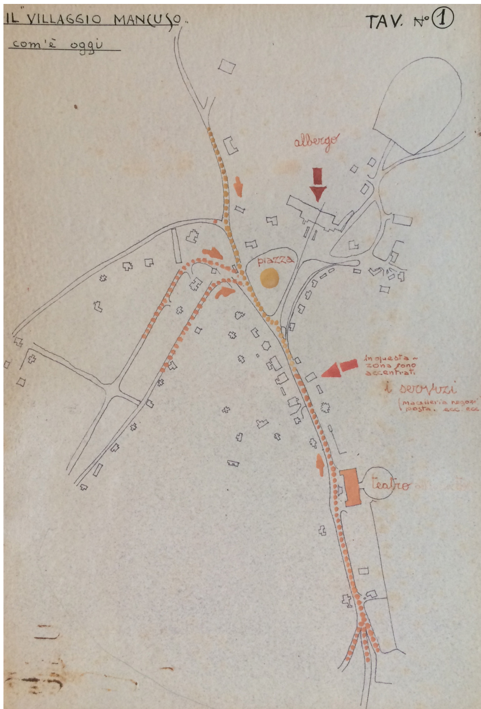
Fig. 8-9: Roma, Planimetria dello stato di fatto del Villaggio Mancuso. (ACS, Fondo Enitea, b.9, fasc.112); Schizzo prospettico dell'ingresso della pensione tipo (ACS, Fondo Enitea, b.9, fasc.112).