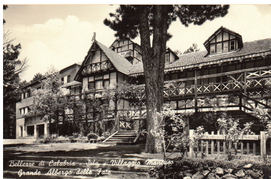
Fig. 15: Nuovo fabbricato aggiunto all'Albergo delle Fate.