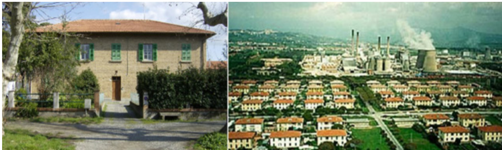
Fig. 6. “Casa di tipo 9” per operai (a sinistra); settore delle case per operai sul lato mare della fabbrica (a destra) [Cusmai 2005-06, 133].