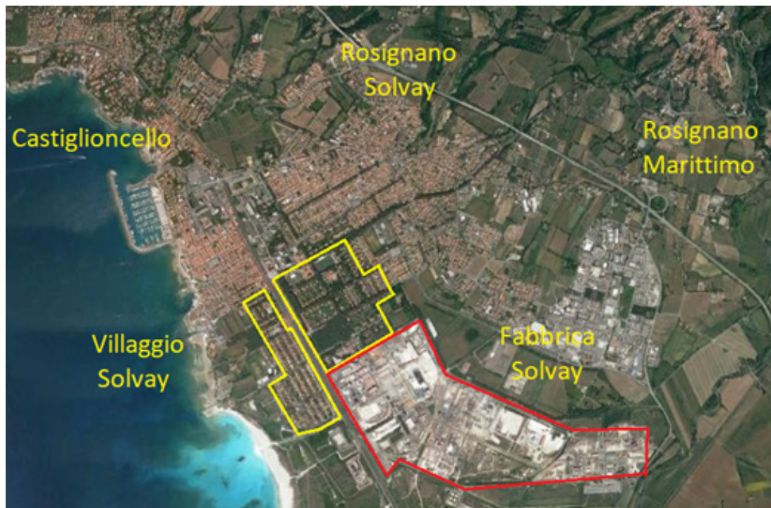
Fig. 2: Il Villaggio Solvay e la fabbrica all'interno del territorio di Rosignano (elaborazione dell'autore su base Google Earth).

La fabbrica rimane separata dalle abitazioni mediante una fascia verde di circa 250 ettari, al limite della quale inizia il tessuto insediativo, costituito da una serie di costruzioni, la cui tipologia rispecchia la rigida divisione delle mansioni all'interno della fabbrica ma che rimane sempre attenta alla buona qualità dei manufatti e alla presenza di orti e giardini; al centro dell'insediamento