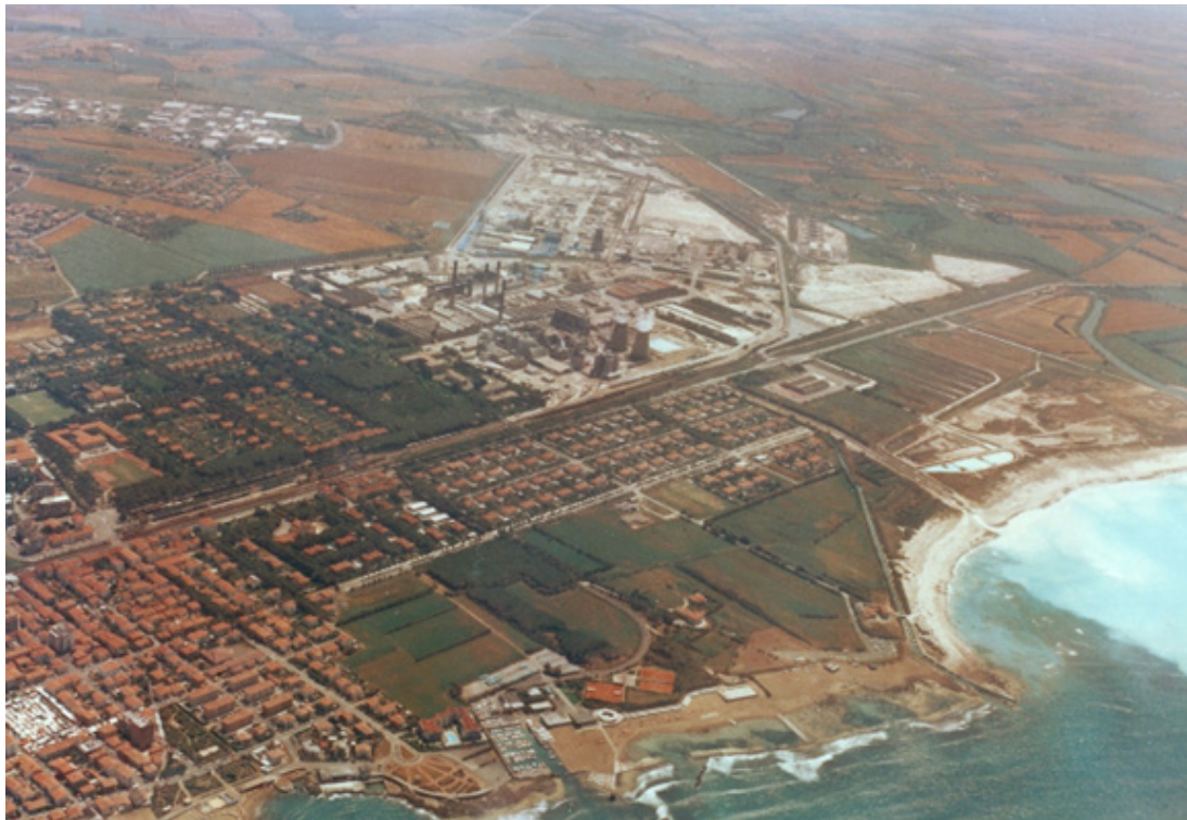
Fig. 8. Il Villaggio Solvay e la fabbrica in una foto aerea della fine degli anni '70 [Cusmai 2005-06, 90].

Del resto, però, questa non sembra una peculiarità di quel periodo storico; basta osservare l'organizzazione urbana del nostro tempo per renderci conto di come, mutatis mutandis, non