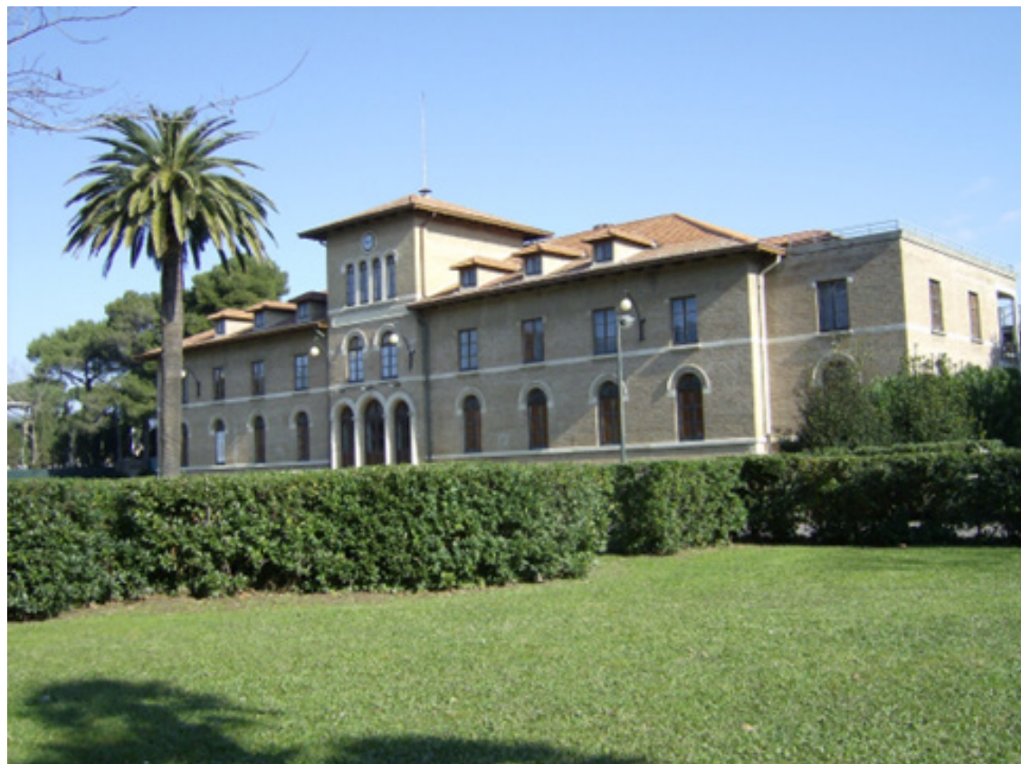
Fig. 7. Il Teatro Solvay [Cusmai 2005-06, 158].