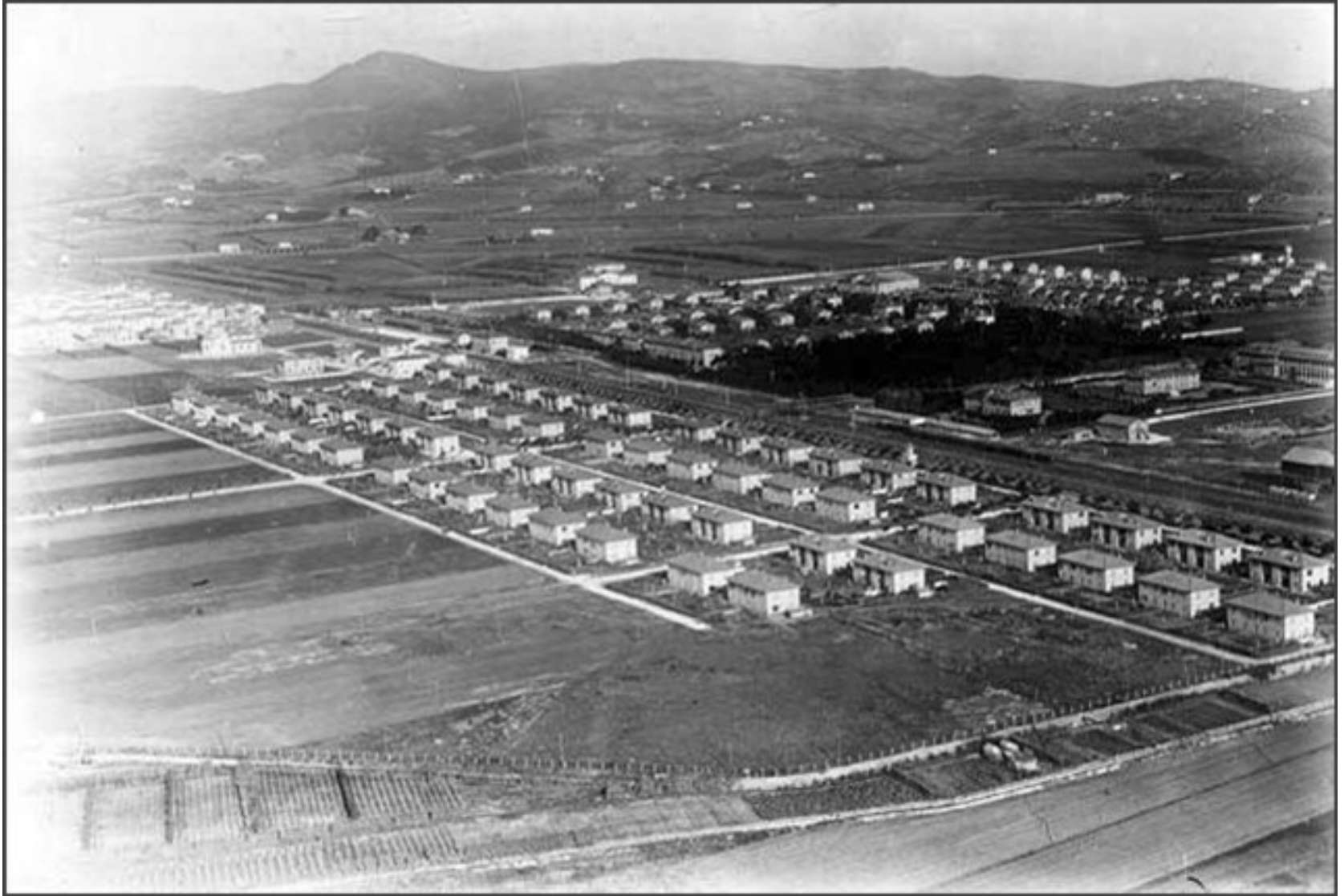
Fig. 3: Il Villaggio Solvay nel 1938 ( http://www.lungomarecastiglioncello.it/rosign_solvay/ros_solv_ieri/Fotogalleria_9_Cittagiardino/data/images1/immagine26_38.jpg , ottobre 2022).

to, poi, sorge una serie di edifici destinati alla vita pubblica e sociale, quali il teatro, gli impianti sportivi, le scuole, l'ospedale e il grosso edificio dei servizi collettivi. Gli stili architettonici denotano una chiara impronta nordica e le prime case, così come il teatro, progettate dall'ingegnere belga Jules Brunfaut, hanno tetti aguzzi e facciate semplici a mattoni scuri; le costruzioni successive, a partire dagli anni '30, sono, invece, più vicine allo stile mediterraneo. Complessivamente, il villaggio consta di 199 edifici residenziali, suddivisi in 655 unità abitative articolate in numerose tipologie corrispondenti alla gerarchia aziendale: si passa dalle case operaie, ampie circa 80 mq e ubicate in edifici quadrifamiliari, a quelle per gli impiegati leggermente