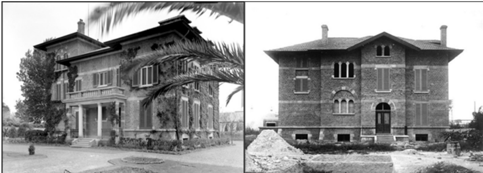
Fig. 5. La villa del direttore (a sinistra) e una delle tre ville per dirigenti (a destra) in due immagini del 1923, appena dopo la costruzione ( http://www.lungomarecastiglioncello.it/rosign_solway/ros_solv_ieri/Fotogalleria_9_Cittagiardino/data/images1/tipo_1_1920.jpg , ottobre 2022), ( http://www.lungomarecastiglioncello.it/rosign_solway/ros_solv_ieri/Fotogalleria_9_Cittagiardino/data/images1/dscf0667.jpg , ottobre 2022).