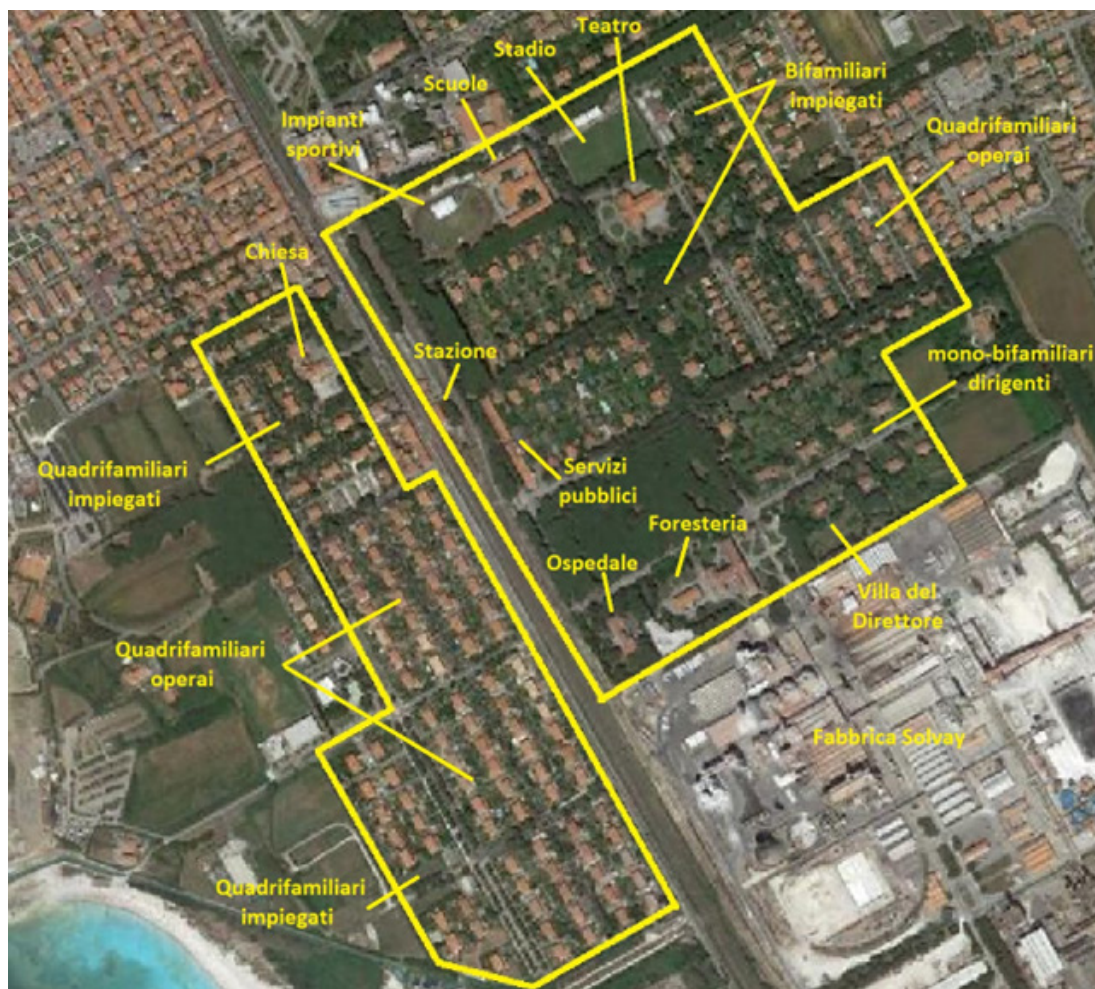
Fig. 4: L'articolazione interna del Villaggio Solvay (elaborazione dell'autore su base Google Earth).

più grandi e con terreni più ampi, per i quadri, bifamiliari con superficie di circa 130 mq, fino alle tre ville unifamiliari per i dirigenti. Infine, vi è la villa del direttore, costruita nel 1920, molto vicino all'ingresso della fabbrica in chiaro stile nordico, con rifiniture prestigiose, una superficie di 350 mq e un parco che supera gli 8.700 mq. Lussuose e spaziose anche le ville destinate ai dirigenti, realizzate anch'esse a partire dal 1920. Pur essendo meno imponenti della villa del direttore, con essa condividono le rifiniture di pregio e l'ampiezza degli spazi interni ed esterni. Interessanti, nonché le più numerose, sono le cosiddette case di tipo 9 destinate agli operai, delle quali, nelle diverse varianti, esistono 82 esemplari costruiti fra il 1918 e il 1926, in due grandi aree a nord e a ovest della fabbrica, cui se ne aggiungono altre 17 erette nel secondo dopoguerra. Esse costituiscono il prototipo delle abitazioni operaie, riallacciandosi in modo evidente alle discussioni teoriche in voga all'epoca sulla questione delle abitazioni per la classe operaia [Magrini 1910]. Si tratta di costruzioni semplici e senza orpelli, che badano al comfort e alla praticità, locate a canoni molto bassi ai lavoratori. Site in edifici quadrifamiliari a due piani, le case, mediamente di un'ottantina di mq divisi in 4/5 stanze, hanno a disposizione circa 350 mq di terreno a