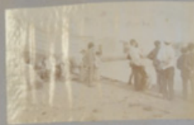
Affacciati e sfacciati alla balconata di Via Conacciolo.