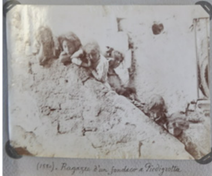
(1916). Ragazzo d'un sandeo a Podigrotta