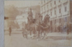
Donne con marce - In Capotoni Umberto I. Parapiglia mattina dei cavalli