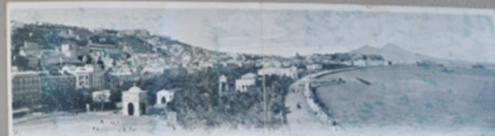
Riviera di Chiara - Esposizione alla Villa Maji - Via Conacciolo - Piazza Umberto I.