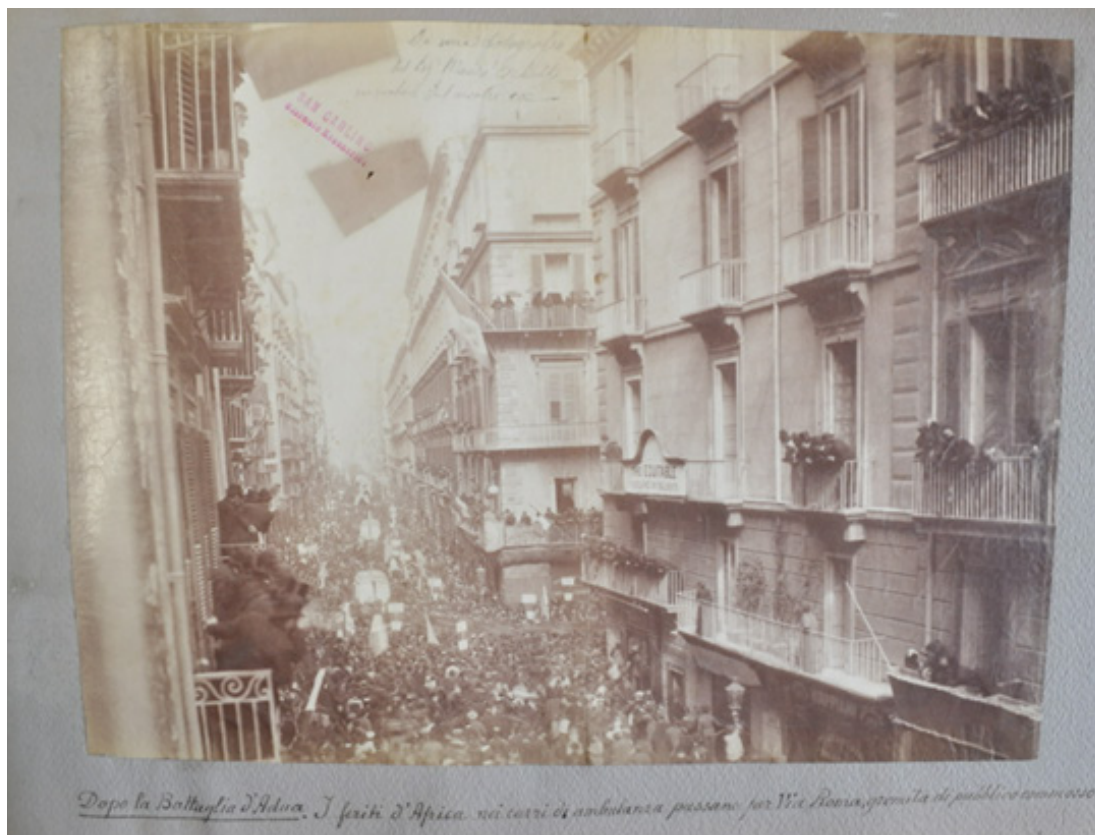
Fig. 8: Album D'Amato, foglio 56 ( Raccolta di Fotografie di Napoli 1930, in http://www.polodigitalenapoli.it/it/viewer/#/main/viewer?idMetadato=3310780&type=iccd ).