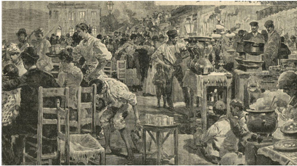
Fig.3: Gennaro D'Amato, Una sera a Santa Lucia prima delle demolizioni del Risanamento , xilografia, in «L'Illustrazione Popolare», 1897.