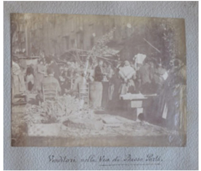
Venditori nella Via di Basso Porto.