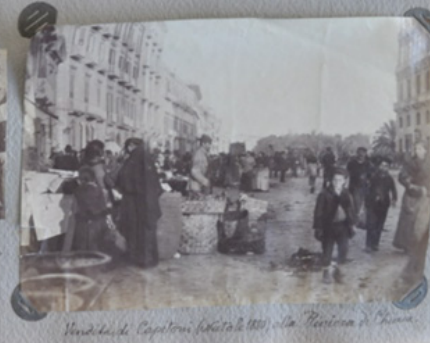
Venditori di Capotoni (foto del 1900) alla "Pensione di Chiara".