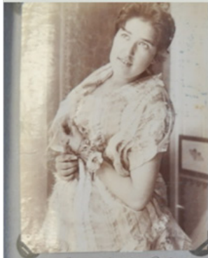
Una "fannachera" di Podigrotta.