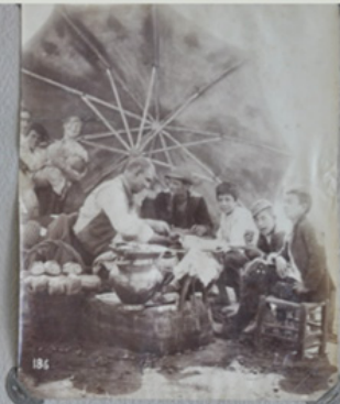
Venditore di "Kavuzze" sotto.