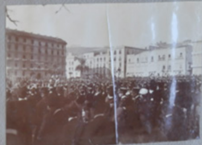
In Piazza Umberto I. La recitata della legge del 25 gennaio 1900 (25 gennaio 1900)