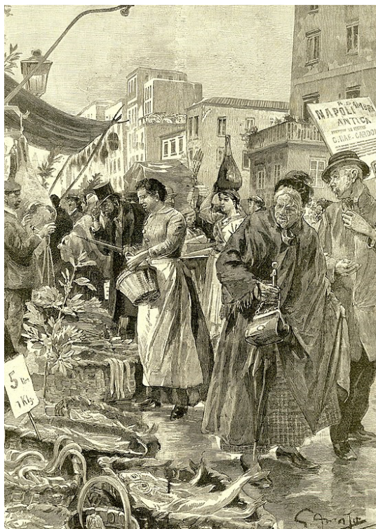
Fig. 5. Gennaro D'Amato, Il Natale a Napoli. La vendita del capitone , xilografia, in «L'Illustrazione Popolare», 1891.

1887 commissiona a Vincenzo Migliaro sei dipinti dedicati alla Napoli antica in via di essere trasformata; la serie viene ultimata nel 1901. Sul piano editoriale spiccano le dispense di «Napoli Antica» di Raffaele D'Ambra, che vanno dal 1889 al 1892, anno in cui ha inizio la rivista «Napoli nobilissima», con un intento dichiaratamente storico-documentario. Intanto D'Amato lavora per riviste a scala nazionale, trasferendo in illustrazioni le fotografie della Napoli popolare, in procinto di essere colpita dalla nuova politica urbanistica. Una sera a Santa Lucia prima delle demolizioni del risanamento. Una Napoli vecchia ora sparita del 1897 indica il rapporto stretto fra fotografia e illustrazione: troviamo nell'album, al foglio 82, la foto che viene ripresa in una parte della xilografia. Da notare la mise en abîme della fig. 5, che rappresenta una scena di strada del Natale 1891, dove compare il manifesto che pubblicizza «Napoli Antica».