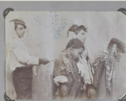
I "Cavalli": Reduci dalla festa di Podigrotta.