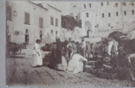
Quartiere delle tregge d'Apria.