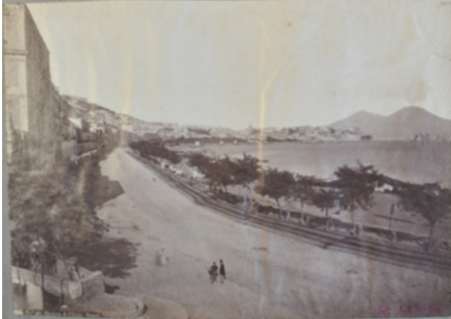
La "Riviera di Chiara" - Anchemaspungia di Chiara.