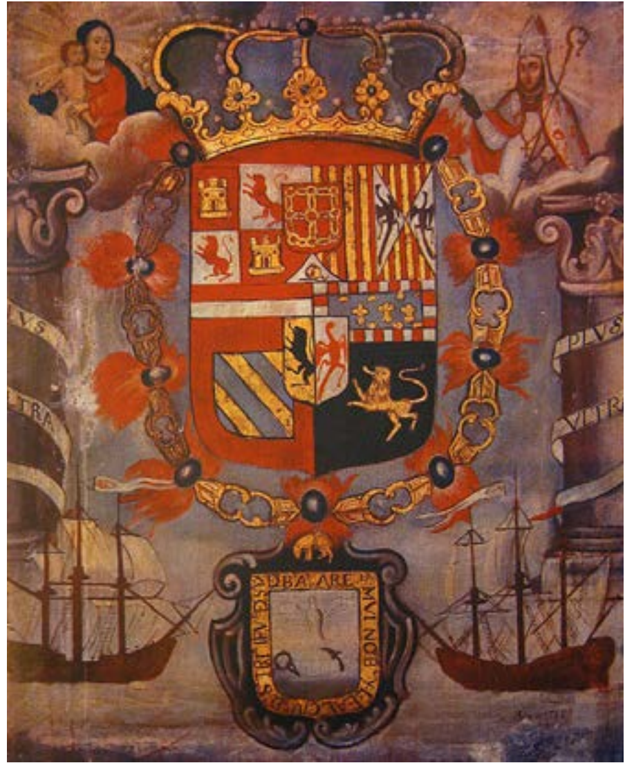
Fig. 5: Autor desconocido, Blasones heráldicos de Buenos Aires, 1784 ( La Ilustración Histórica Argentina 1910).