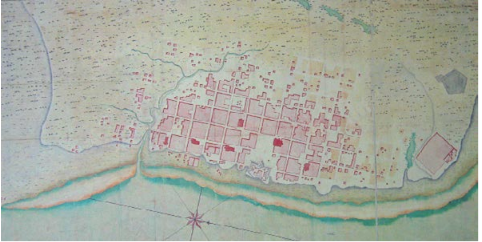
Fig. 2: Autor desconocido (posiblemente uno de los ingenieros militares de Buenos Aires), Plano de Buenos Aires, 1720 (Archivo Cartográfico y de Estudios Geográficos de Madrid).