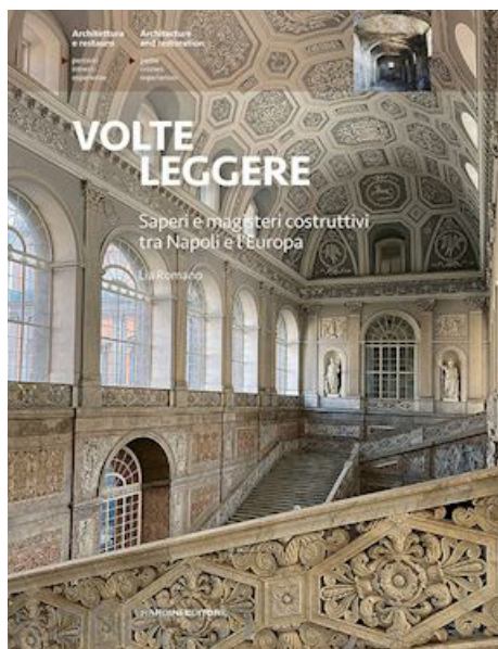
ROMANO, L. (2021). Volte leggere. Saperi e magisteri costruttivi tra Napoli e l'Europa , Firenze, Nardini Editore.