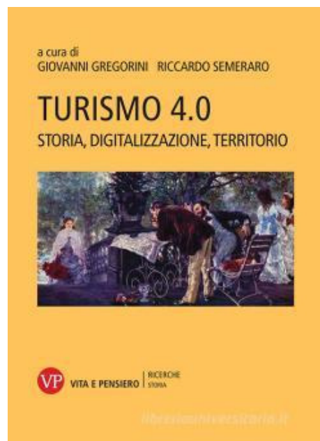
Turismo 4.0: storia, digitalizzazione, territorio (2021). A cura di G. Gregorini, R. Semeraro, Milano, Vita e pensiero.