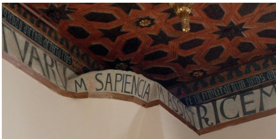
Fig. 10. Sala capitular. Detalle sobre hipótesis de realización de las inscripciones.

habituadas a ambas culturas gráficas 93 . Por tanto, sería realizada entre 1435 y 1456, bajo el influjo del pontificado de Cartagena. Sin embargo, este planteamiento también choca con esa cronología paleográfica que dábamos para la escritura prehumanística. Resulta demasiado temprana 94 . Por tanto, la segunda hipótesis, de acuerdo con la datación paleográfica, sería que la prehumanística fuera realizada con posterioridad, durante el último cuarto de siglo. Una tercera opción, es que estemos antes una copia epigráfica producto de la restauración. Esto es, considerar que fuese actualizada durante la reforma de Martín de la Haya. Se adaptaría la inscripción a los cambios perpetrados en las paredes de la sala tratando de copiar el texto y el modelo tipográfico preexistente. Esto explicaría la fuerte influencia humanística que tiene el trazado de muchas de sus letras, pues sus calígrafos ya pertenecerían a esta cultura gráfica. En este caso, se habría hecho lo mismo con la inscripción en gótica minúscula para acomodarla a esos espacios ocultos (Fig. 10).