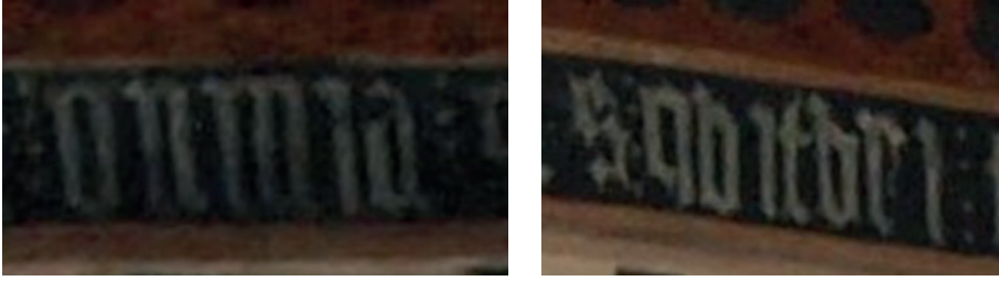
Fig. 11. Sala capitular. Detalle errores de rogatorio.

Por tanto, sabemos que al menos una de las inscripciones se pensó y ejecutó en tiempos del pontificado de Cartagena. Toca ahora identificar y concretar al autor de nuestras inscripciones y su intención comunicativa. Para ello lo primero de todo es analizar el contexto en donde se grabaron las inscripciones; esto es, el cometido que tenían este espacio. Decíamos más arriba que los indicios documentales sugieren que para estas fechas puedo utilizarse como sacristía, biblioteca, archivo y, ocasionalmente, zona de reunión del cabildo. Cronológicamente, Ramos Merino demuestra que para 1426 la biblioteca estaba ubicada en el espacio que hoy ocupa la sala capitular 95 . Campos y Teijeira hablan de la misma función, pero retrasan esa fecha hasta 1435 96 . En el lugar habría también un scriptorium y el archivo 97 . El acceso únicamente estaría habilitado para el cabildo. Las mismas autoras sostienen como un rasgo definitorio de estas bibliotecas ser un nuevo espacio, independiente, promovido, directa o indirectamente por un obispo, pero decidido y proyectado por el capítulo 98 . Por su parte, Conejo Díez señalaba que, en la primera etapa, tras su construcción, este espacio funcionó como sacristía 99 . Tesoro y sacristía son dos realidades que suelen ir unidas en buena parte de las catedrales medievales.