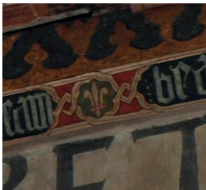
Fig. 8. Sala capitular. Detalle heráldico. Flor de lis.

Bajo su mandato sitúa María Luisa Concejo la realización del taujel de la sala capitular 89 . El dato determinante es la heráldica de los Santa María. Esta aparece separando, de formas más o menos arbitraria, los proverbios de la inscripción en gótica minúscula (Fig. 8):