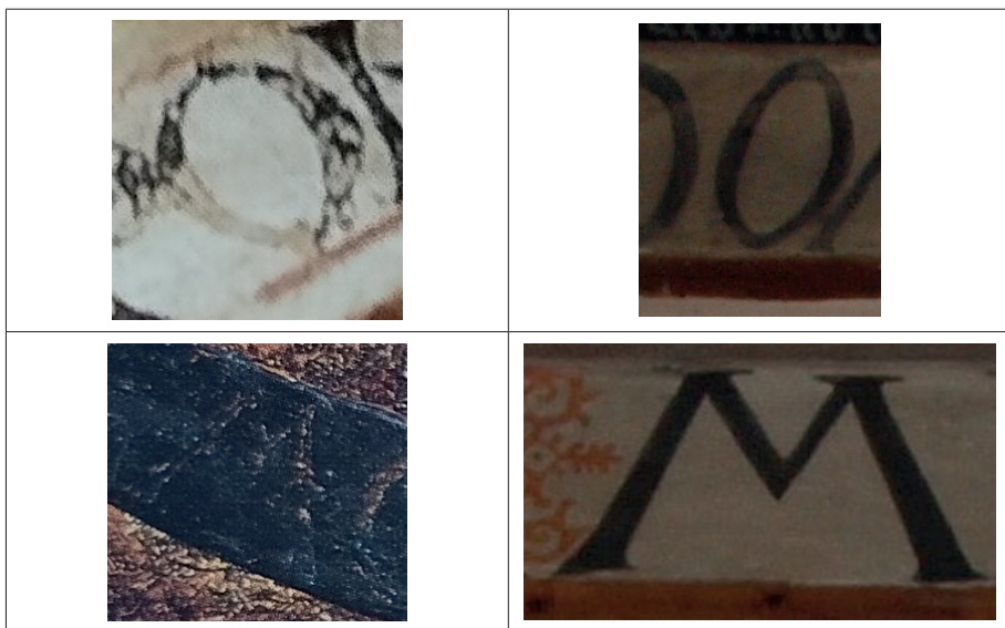
Fig. 12. Cuadro comparativo de escrituras.

Las proximidades nos obligan a comparar también la escritura gótica utilizada por de la Cruz en algunas de sus obras, por si fuera conveniente retrasar la cronología de la otra inscripción. Sin embargo, aquí no hemos encontrado similitudes significativas, lo que supone otro argumento a favor de la hipótesis de dos momentos de ejecución. Además de en el retablo de la Concepción, se ha documentado actividad de este artista en Burgos entre 1482 y 1500, franja cronológica que podría coincidir perfectamente con la datación paleográfica de la inscripción en prehumanística 105 .