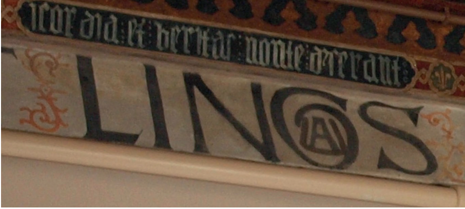
Fig. 3. Sala capitular. Detalle abreviatura. Escritura prehumanística.

Aquí el propio recinto donde se encuentra el conjunto epigráfico y la ubicación de las dos inscripciones son el contexto que justifican y a la vez explican su materialidad. Ya hemos dicho que han sido desarrolladas perimetralmente alrededor del friso. Es una posición alejada del espectador. Como es habitual, la distancia se resuelve, en primera instancia, con la utilización de una escritura de gran tamaño y caracteres mayúsculos. Esto ocurre sólo en uno de los casos. En mayúscula prehumanística se caligrafió un texto de fácil lectura, donde prácticamente todas las palabras se desarrollan por completo. Únicamente en la parte final, y debido a la necesidad de economizar espacio para poder incluir todo el escrito, el calígrafo abrevia palabras. Una primera vez inscribe dentro de la G la U y dentro de ésta una A en la palabra linguas (Fig. 3).