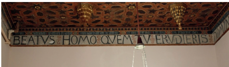
Fig. 5. Sala capitular. Detalle elementos de separación. Escritura prehumanística.

Además, las palabras han sido debidamente separadas mediante elementos florales que acentúan ese espacio entre términos. Todo ello en aras de facilitar la lectura. Véase la imagen 39 (Fig. 5):