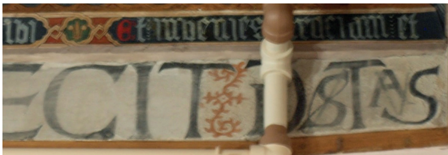
Fig. 4. Sala capitular. Detalle segunda abreviatura. Escritura prehumanística.

Además, las palabras han sido debidamente separadas mediante elementos florales que acentúan ese espacio entre términos. Todo ello en aras de facilitar la lectura. Véase la imagen 39 (Fig. 5):