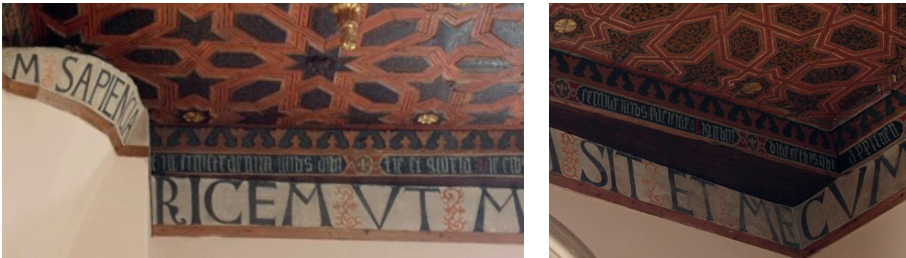
Fig. 7. Sala capitular. Detalle disposición de los textos.

Este hecho produce una dicotomía en la comunicación publicitaria del conjunto. Hay, además, otra serie de cuestiones que acentúan esta sensación. Si la primera es el hecho de que se hayan utilizado dos tipos gráficos para cada inscripción, la segunda, es la técnica de ejecución en cada una de ellas. La realizada en gótica minúscula dibujó letras claras sobre un fondo oscuro, que si bien sirven para la llamar la atención e indicar su existencia dificultan la lectura. Por el contrario, en la inscripción prehumanística se invirtió el orden. Son letras oscuras sobre un fondo blanco. En tercer lugar, y relacionado con lo anterior, está la disposición del texto. Aquí también hay diferencias. La inscripción en letras minúsculas sigue el contorno rectangular de la techumbre. La otra, lo hace respetando las irregularidades de las paredes (Fig. 7):