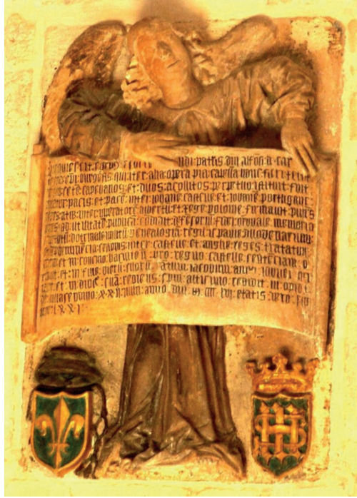
Fig. 9. Capilla de la Visitación. Detalle heráldico. Flor de lis.

Además de compartir el escudo, ambas inscripciones han sido realizadas dentro de la cultura gráfica gótica. Su ejecución bien podríamos situarla en el contexto de la actividad de un taller caligráfico encargado de perpetrar epígrafes de alta calidad ejecutiva en la Seo burgalesa durante todo el siglo XV y comienzos del s. XVI 91 .