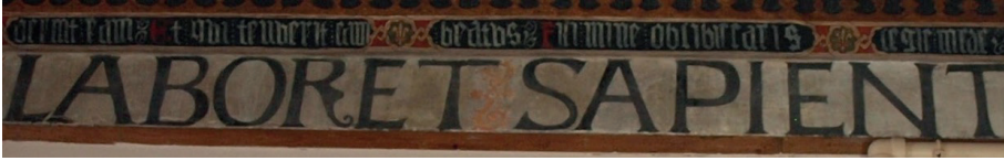
Fig. 6. Sala capitular. Detalle ordinatio inscripción en gótica minúscula.

Este hecho produce una dicotomía en la comunicación publicitaria del conjunto. Hay, además, otra serie de cuestiones que acentúan esta sensación. Si la primera es el hecho de que se hayan utilizado dos tipos gráficos para cada inscripción, la segunda, es la técnica de ejecución en cada una de ellas. La realizada en gótica minúscula dibujó letras claras sobre un fondo oscuro, que si bien sirven para la llamar la atención e indicar su existencia dificultan la lectura. Por el contrario, en la inscripción prehumanística se invirtió el orden. Son letras oscuras sobre un fondo blanco. En tercer lugar, y relacionado con lo anterior, está la disposición del texto. Aquí también hay diferencias. La inscripción en letras minúsculas sigue el contorno rectangular de la techumbre. La otra, lo hace respetando las irregularidades de las paredes (Fig. 7):