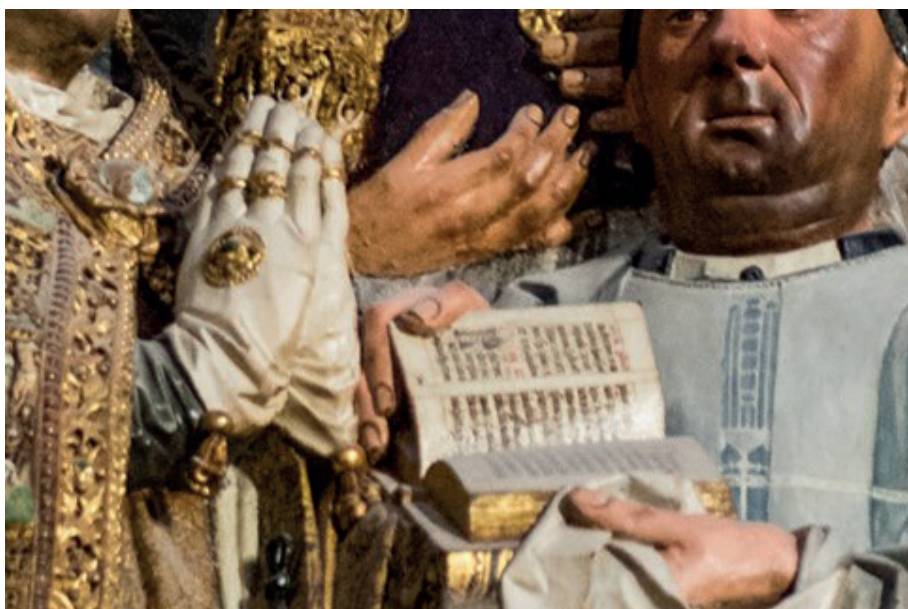
Fig. 1. Retablo de la Concepción. Escrituras de Diego de la Cruz.